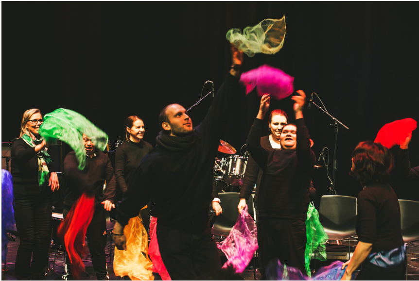
Spelhaugen/Bergen Musikkterapisenter fra Høstfestivalen 2022.