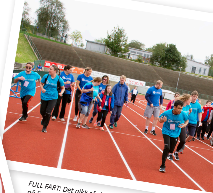
FULL FART: Det gikk så det suste under 60-meteren på Fana Stadion onsdag 31. august.