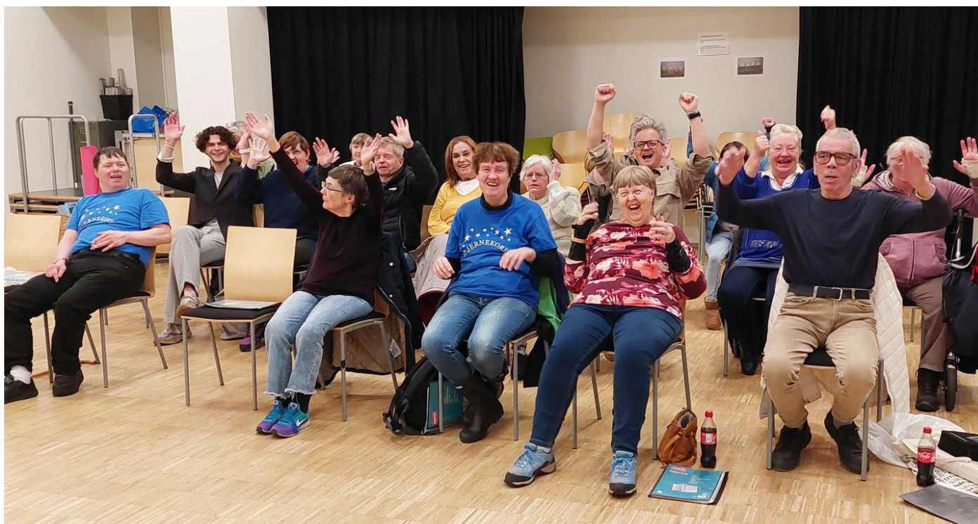
Stjernekoeret startet opp igjen onsdag 2. november. Bli med du også, da vel.

Det er plass til flere sangere i koret. Møt gjerne opp på onsdager. Vi øver på Vitalitetssenteret på Møhlenpris klokken 18.00–19.30. Du er hjertelig velkommen!