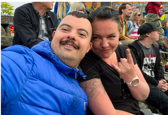
Team Boys og Team Musikk