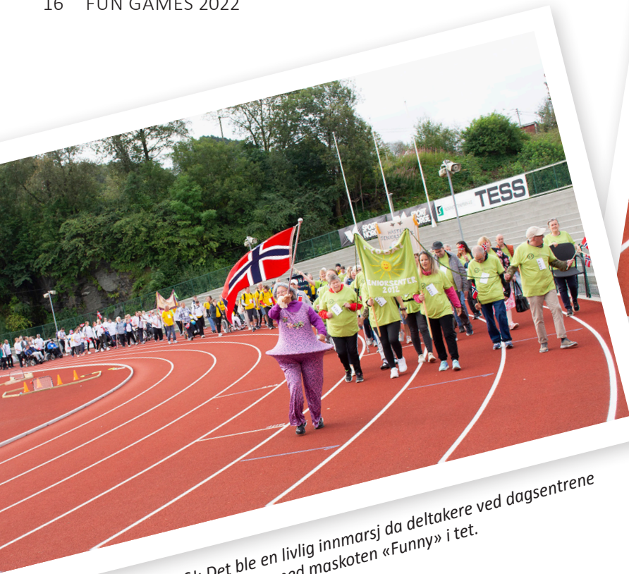
INNMARSJ: Det ble en livlig innmarsj da deltakere ved dagsentrene toget inn på stadion med maskoten «Funny» i tet.