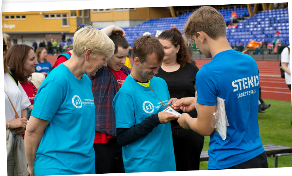
GODE HJELPERE: Dagsentertjenesten arrangerte Fun Games for trettende gang på Fana stadion i år. Gode hjelpere var idrettslinjen fra Stend og ergoterapistudenter.