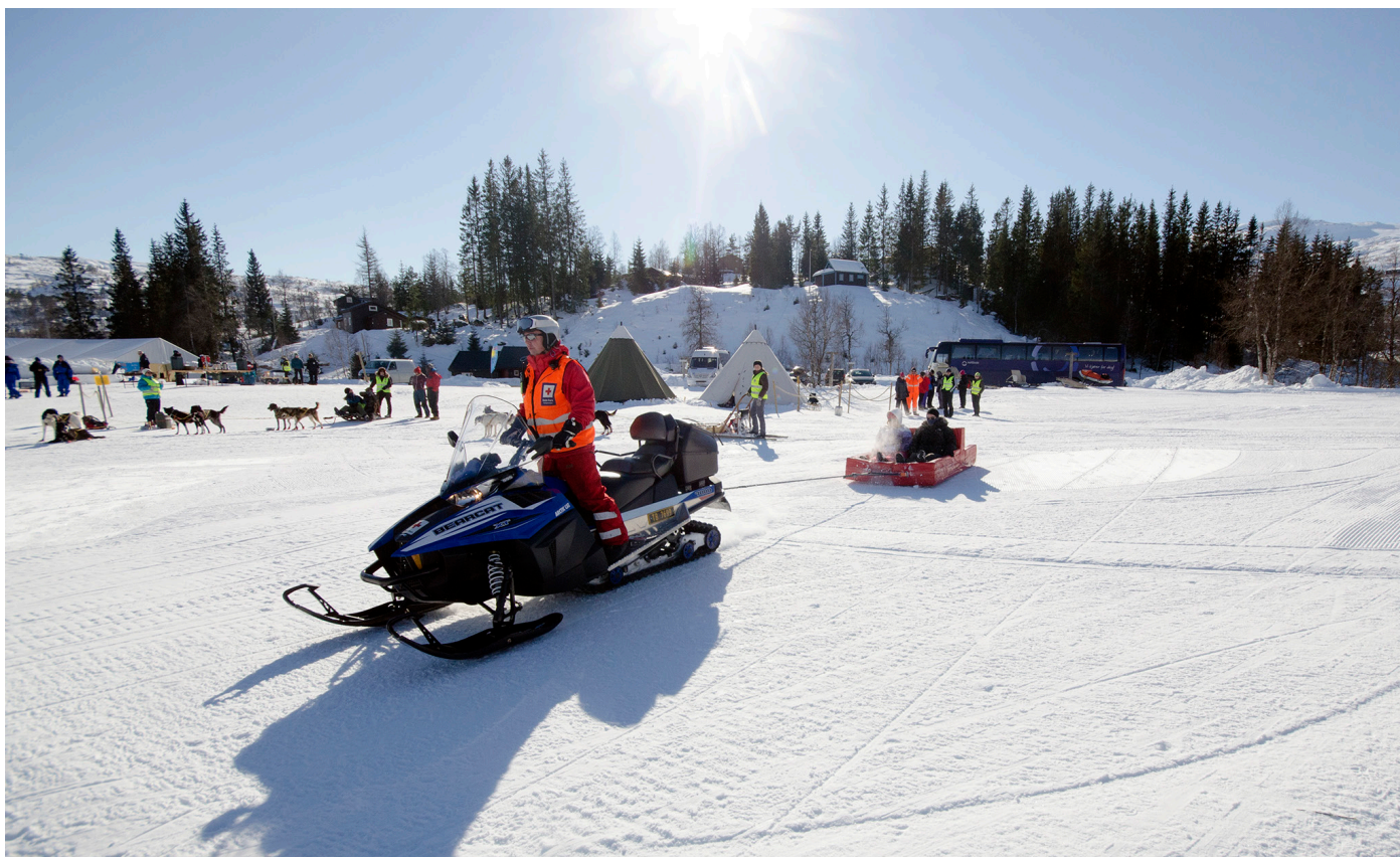
Vinteraktivetsdager på Kvamskogen (fra 2017).