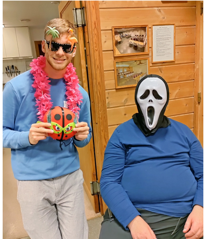
Fra kostymefesten i klubben i Arna 2022.