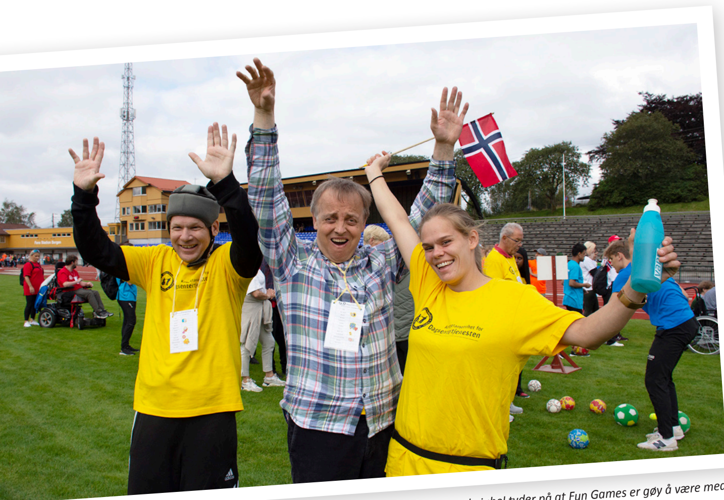
JUBLENDE: Smil, flagg og stormende jubel tyder på at Fun Games er gøy å være med på.