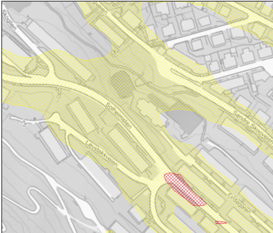
Ved Solheimslie. Gul støysone for vegtrafikk er opptil 133 m brei langs bustadgatene.