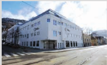
Huduma kwa raia Kaigaten 4.

Tembelea Huduma ya Raia huko Kaigaten 4, mbele ya Byparken, au piga simu 55 56 55 56 . Hapa anapata pia usaidizi wa kuomba nafasi ikiwa hauna nambari ya kijitambulisha ya Kinorweji.