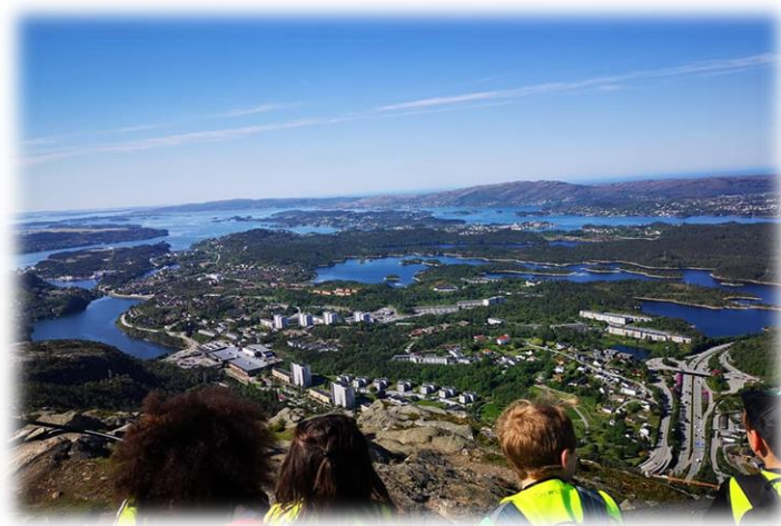
Utsikt over Loddefjord, fra toppen av Lyderhorn.

På høsten vil dere også bli invitert til den første utviklingssamtalen med kontaktlærer. Her kan du som forelder komme med tanker og vurderinger om ditt barn, skolestarten og hvordan overgangen fra barnehagen har fungert.