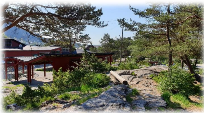
Noe av uteområdet vårt.