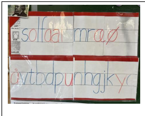
Bokstaver skrevet i bokstavhus.

På 1.trinn handler det mye om å bli kjent med skolen og om hvordan det er å være elev. Vi jobber masse med å bli gode venner og for at alle barna skal oppleve at det er trygt og godt å gå på Loddefjord skole. I tillegg skal vi selvfølgelig også øve på å lese, skrive, regne og mye annet spennende. Det blir også tid til mye lek og moro.