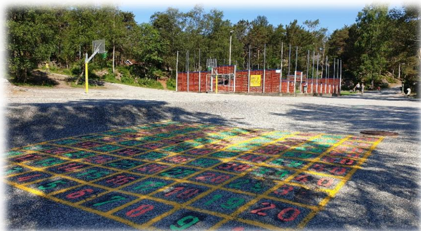
Paradis, 100-rute, basketbane og ballbingen.