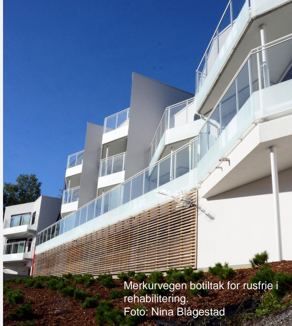
Merkurvegen botiltak for rusfrie i rehabilitering.