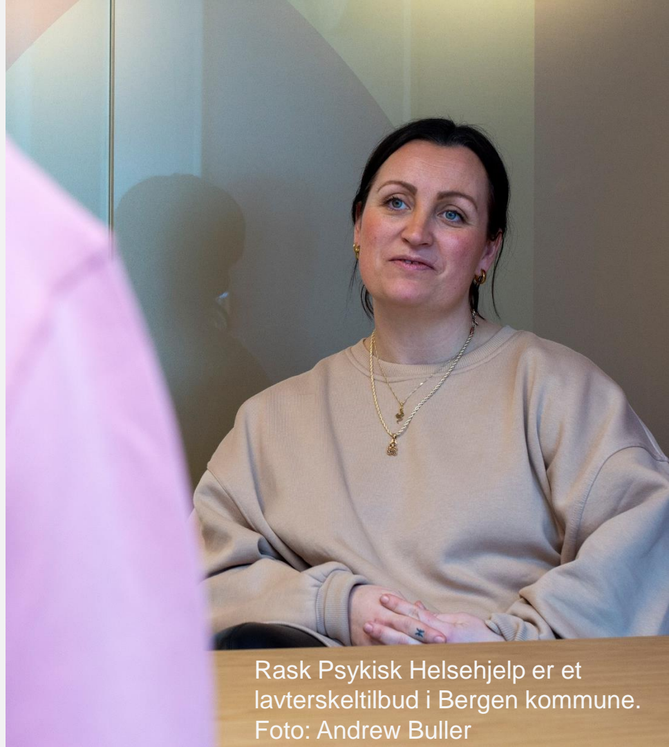
Rask Psykisk Helsehjelp er et lavterskeltilbud i Bergen kommune.