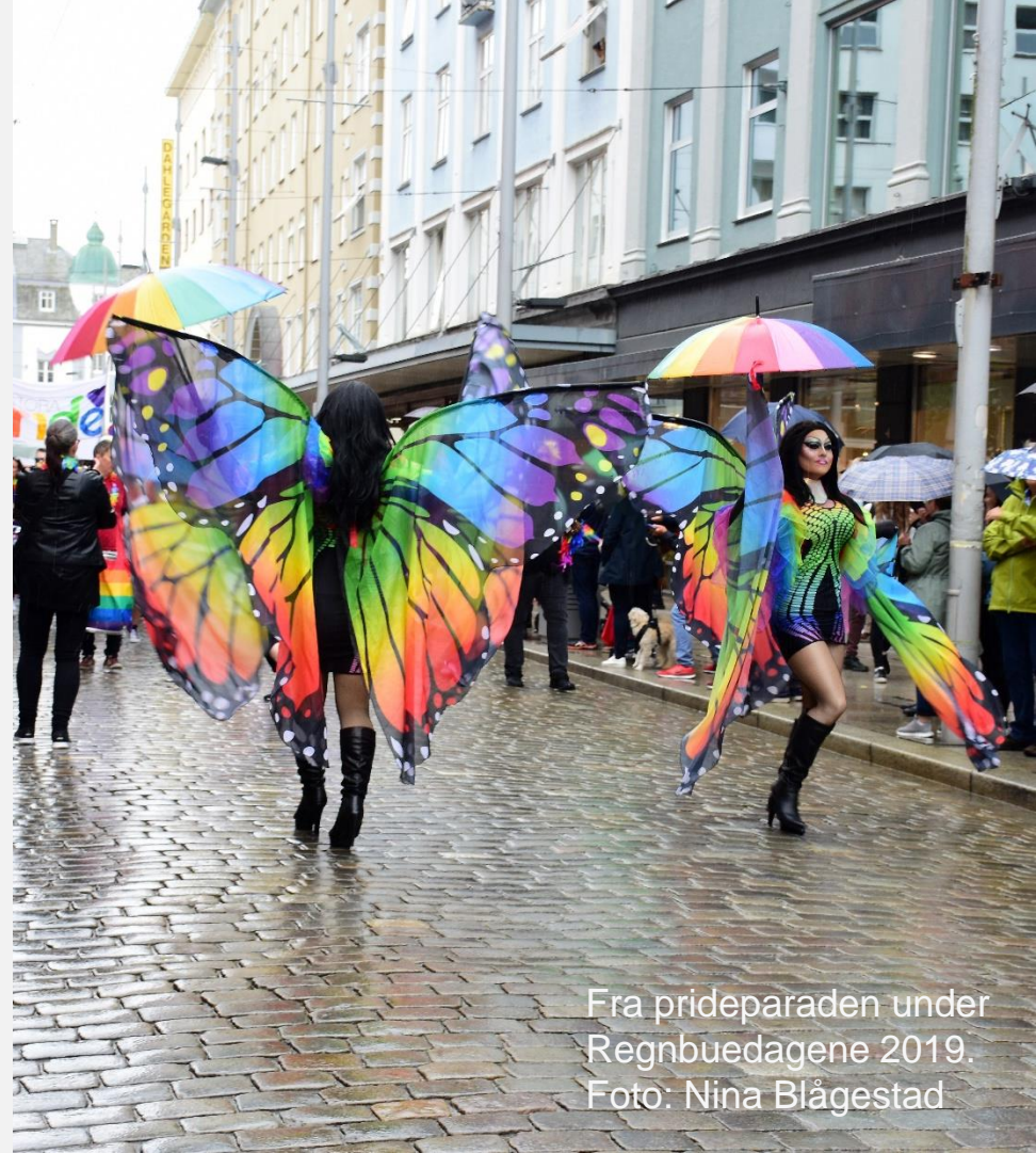
Fra prideparaden under Regnbuedagene 2019.