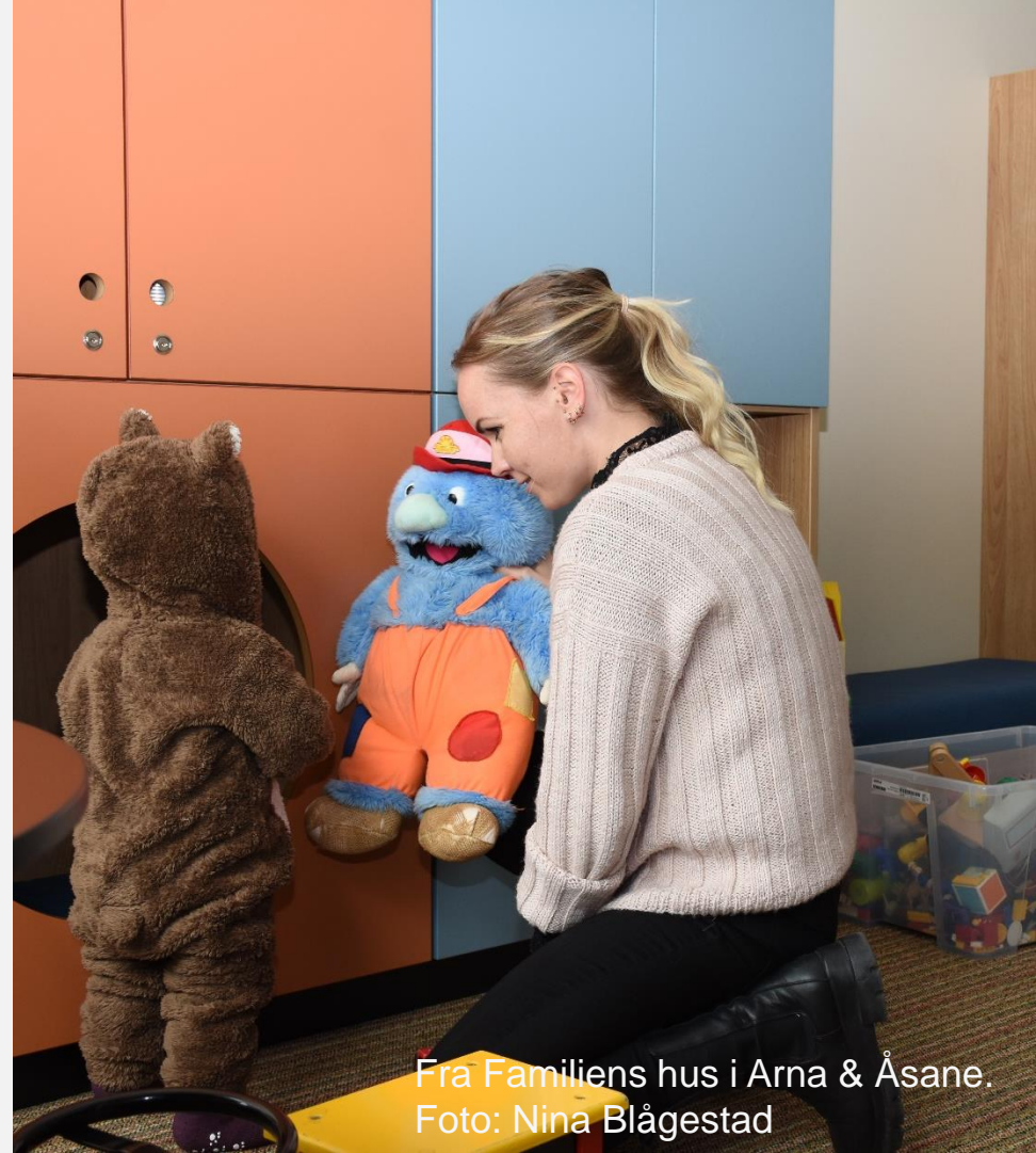
Fra Familiens hus i Arna & Åsane.