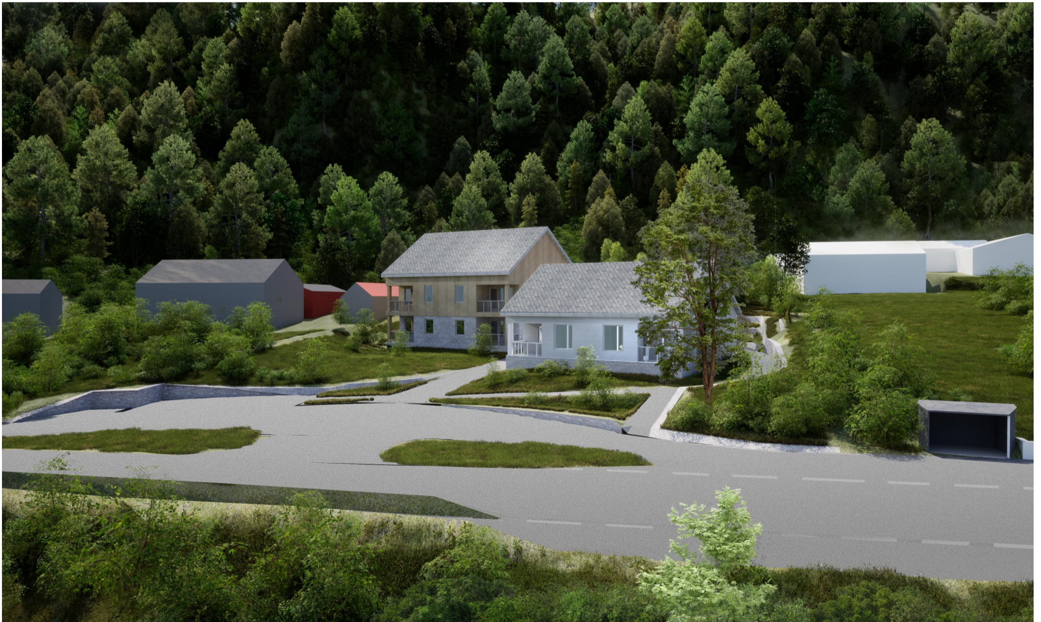
3 Oversiktsbilde sett mot øst/Krokeidevegen