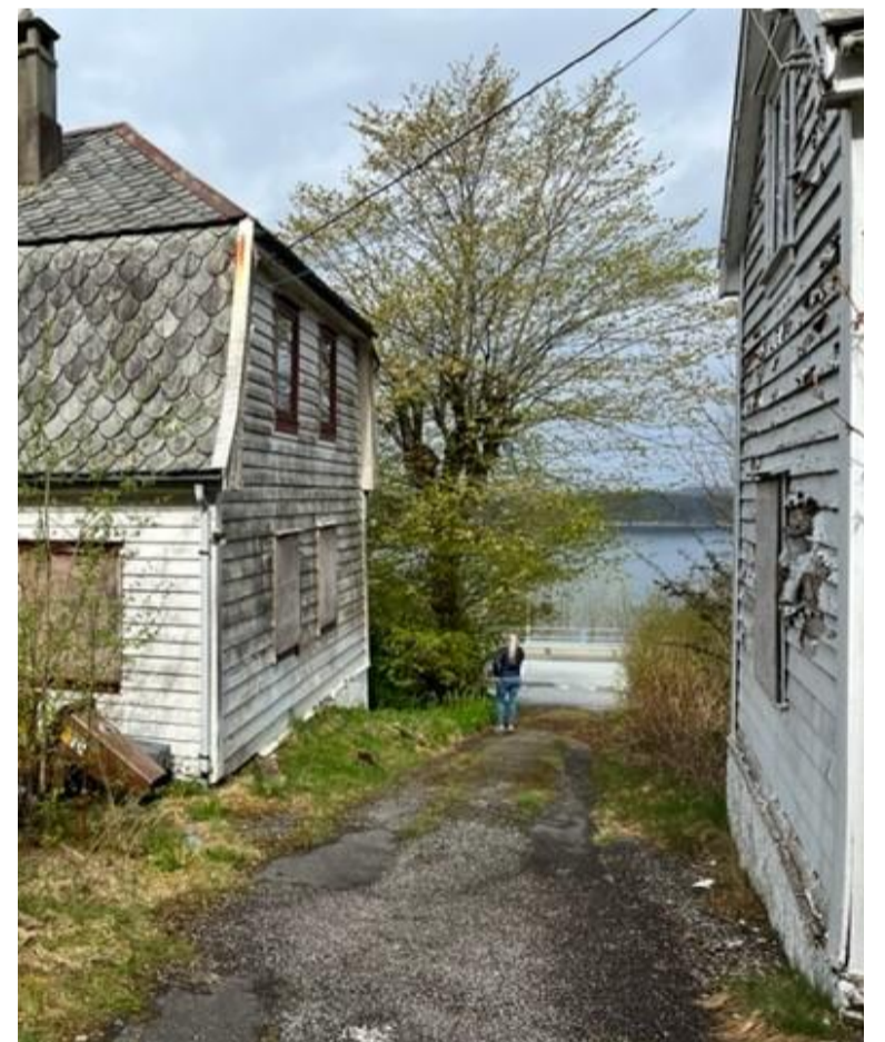
Inngang til tun i eksisterende bebyggelse