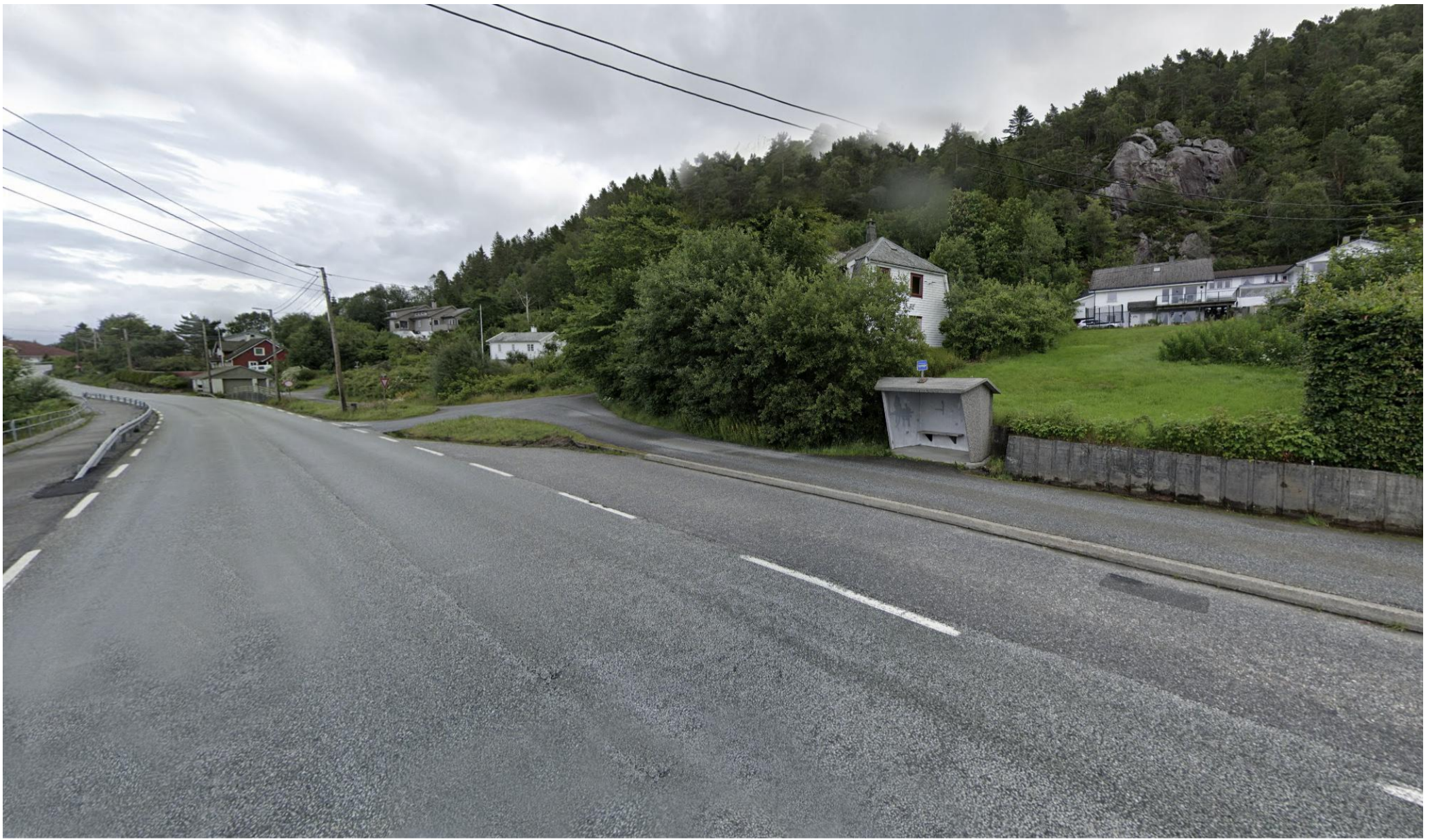
Eksisterende situasjon: 2 Sett fra Krokeidevegen mot nord