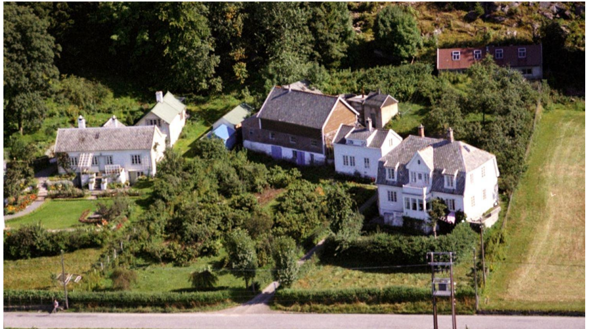
Flyfoto fra 1950-tallet. Planlagt bebyggelse er inspirert av eksisterende bebyggelse og låvebygningen som tidligere har stått på tomten.