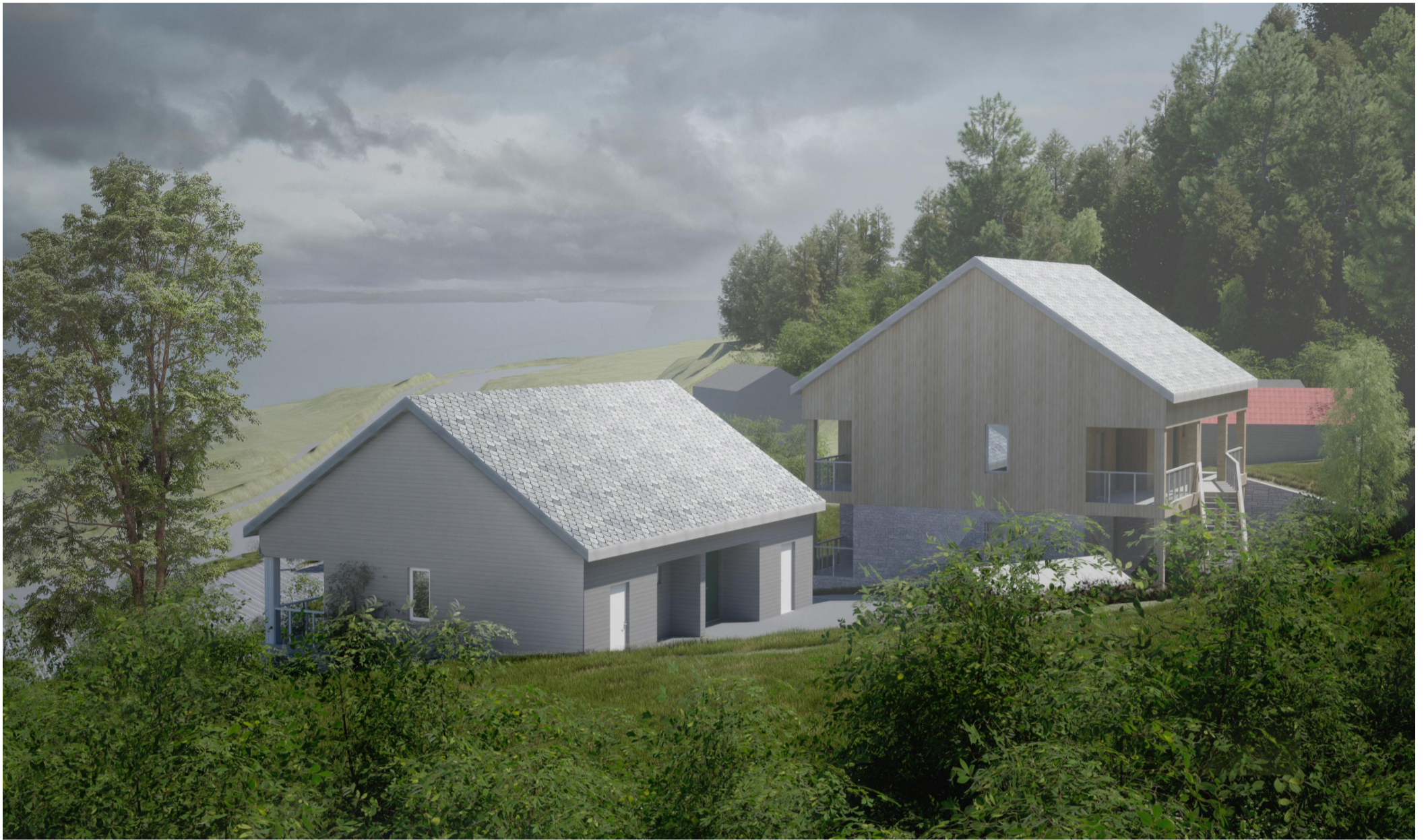
4 Tunet sett mot nord