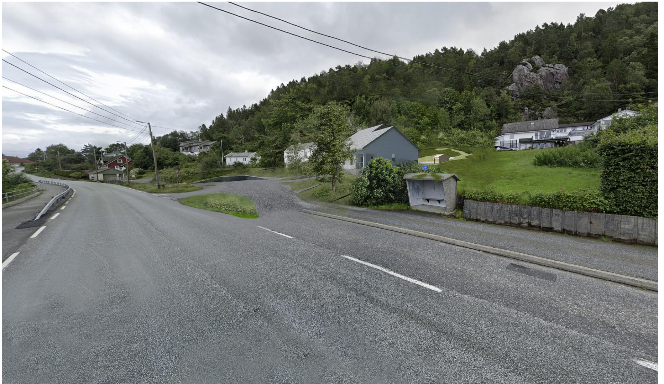
Fremtidig situasjon: 2 Sett fra Krokeidevegen mot nord