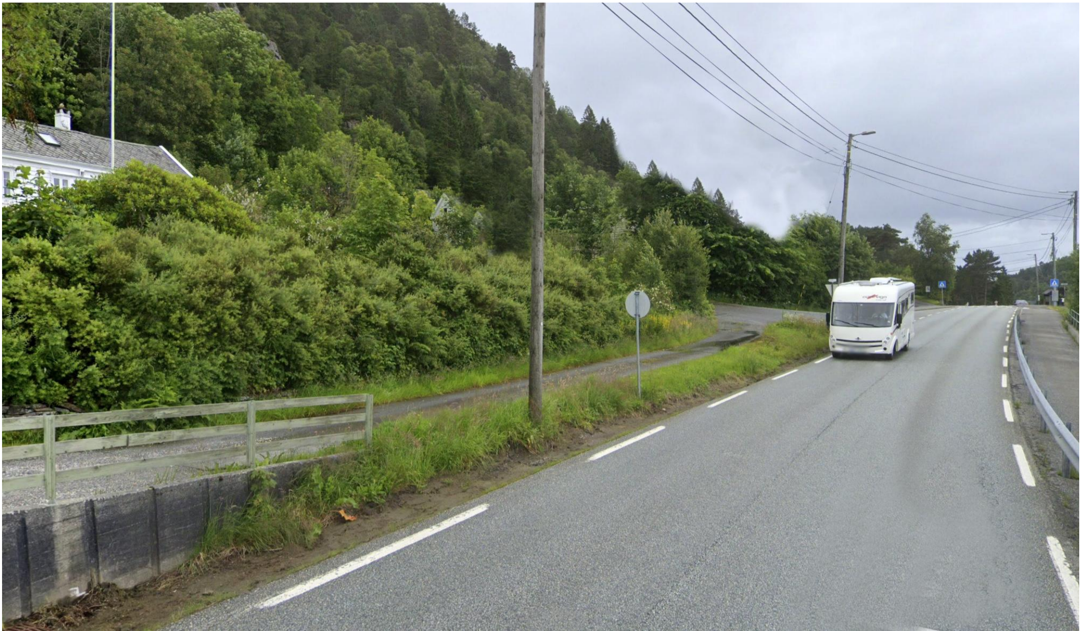
Eksisterende situasjon: 1 Sett fra Krokeidevegen mot sør