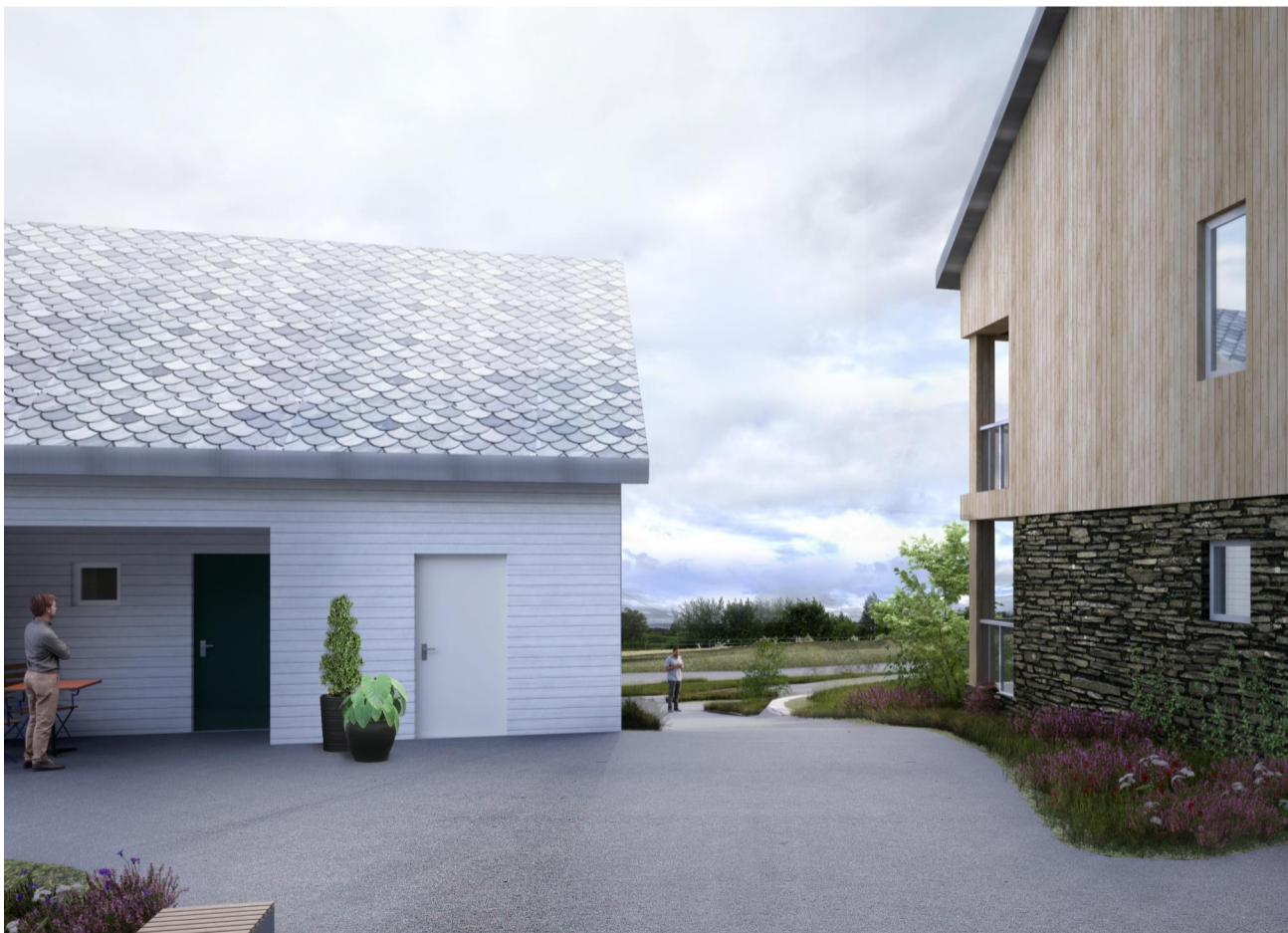
5 Inngang til tunet Eksisterende tun har en markert inngang fra Krokeidevegen. Dette er videreført i den nye bebyggelsen med ny plassering.