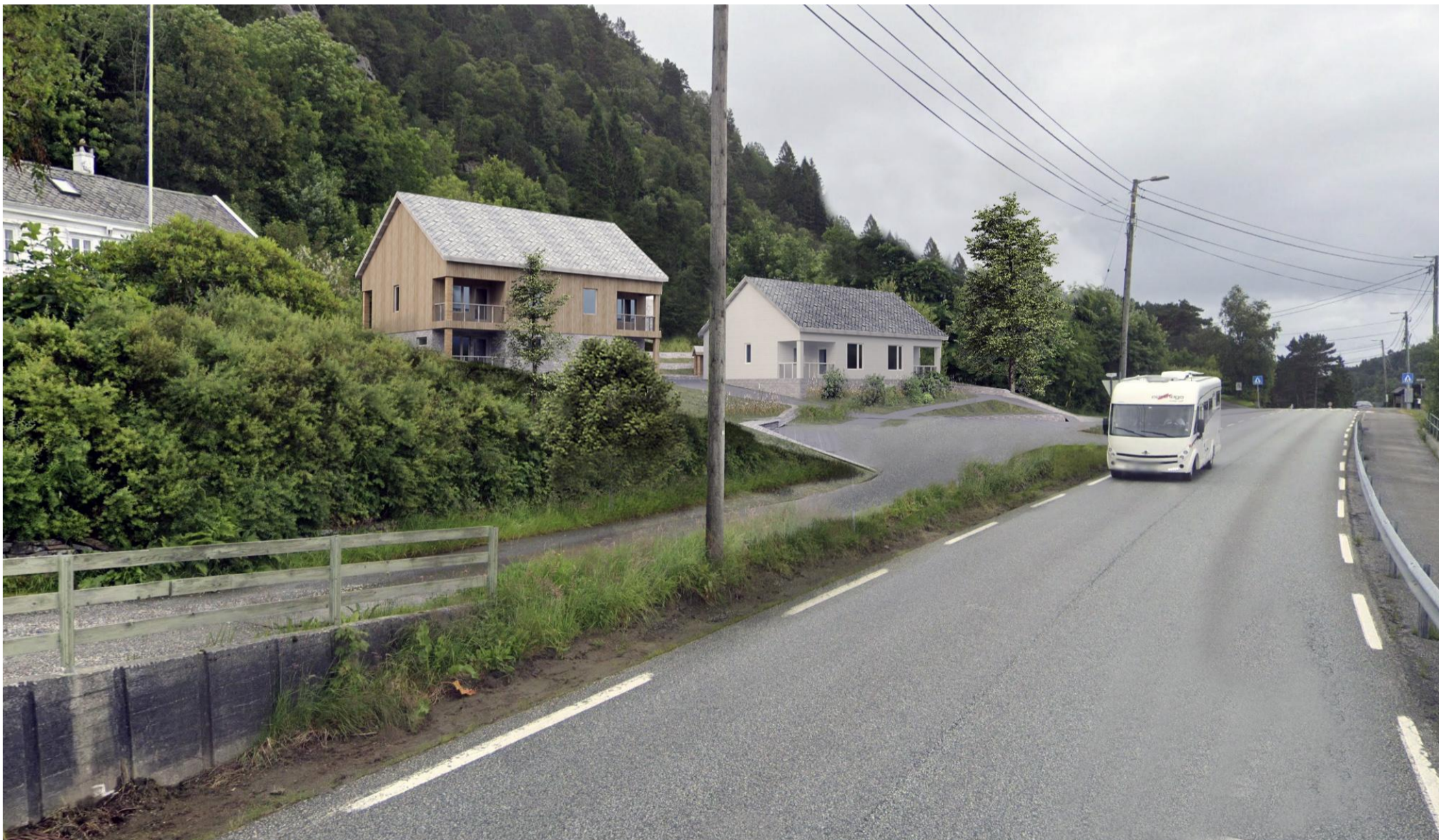
Fremtidig situasjon: 1 Sett fra Krokeidevegen mot sør

Bergen kommune Regulering - Rød utleieboliger