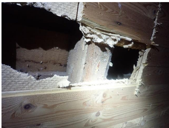
Bilde 6: Takkonstruksjonen sett frå loft

Det er truleg ein asfaltpapp over sutaksborda, dette fører til at sperrekonstruksjonen ikkje kan isolerast utan at det vert etablert eit luftsjikt under dagens sutak. Sperrestyrke er ikkje vurdert.