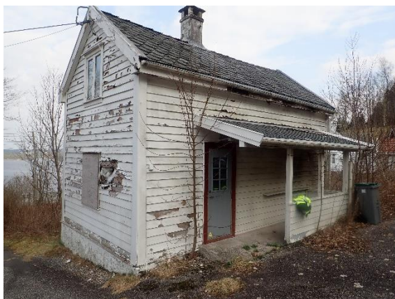
Bilde 1: Annekset

Bygningsmassen på Rød består av to bustadbygg oppført i trekonstruksjonar. Det er i denne kartlegginga berre annekset som er vurdert. Eksakt byggjeår er ikkje kjent, men basert på observerte bygningskonstruksjonar er det vurdert til at annekset er oppført rundt 1950.