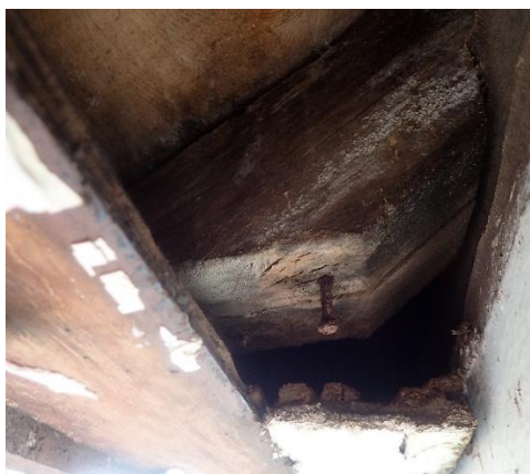
Bilde 7: Sperrrende med litt fuktskade