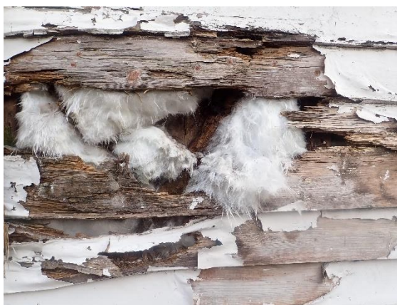
Bilde 5: Store råteskader i yttervegg mot sørvest