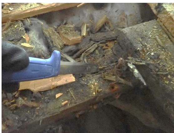
Bilde 3: Råteskader i bjelkelag