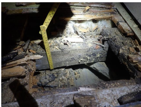
Bilde 2: Oppbygging av golvkonstruksjon

Om bygningen skal nyttast vidare bør heile golvkonstruksjonen rivast opp, og det bør etablerast betonggolv på grunnen i heile bygningen. Om det skal byggast oppatt med trekonstruksjonar må «krypkjellaren» utbetrast slik at det er moglegheit til lufting og inspeksjon (iht. anbefalingar i SINTEF Byggforsk). Sjå bileta under for detaljer rundt oppbygging og skader.