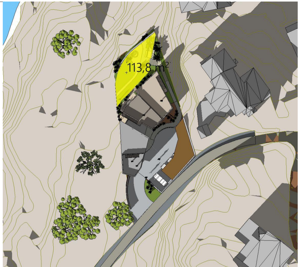
21. Mars kl 16 - Ny situasjon