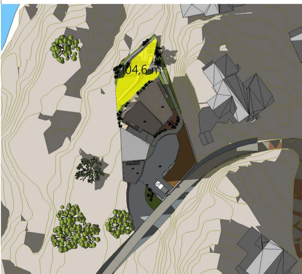
21. Mars kl 19 - Ny situasjon