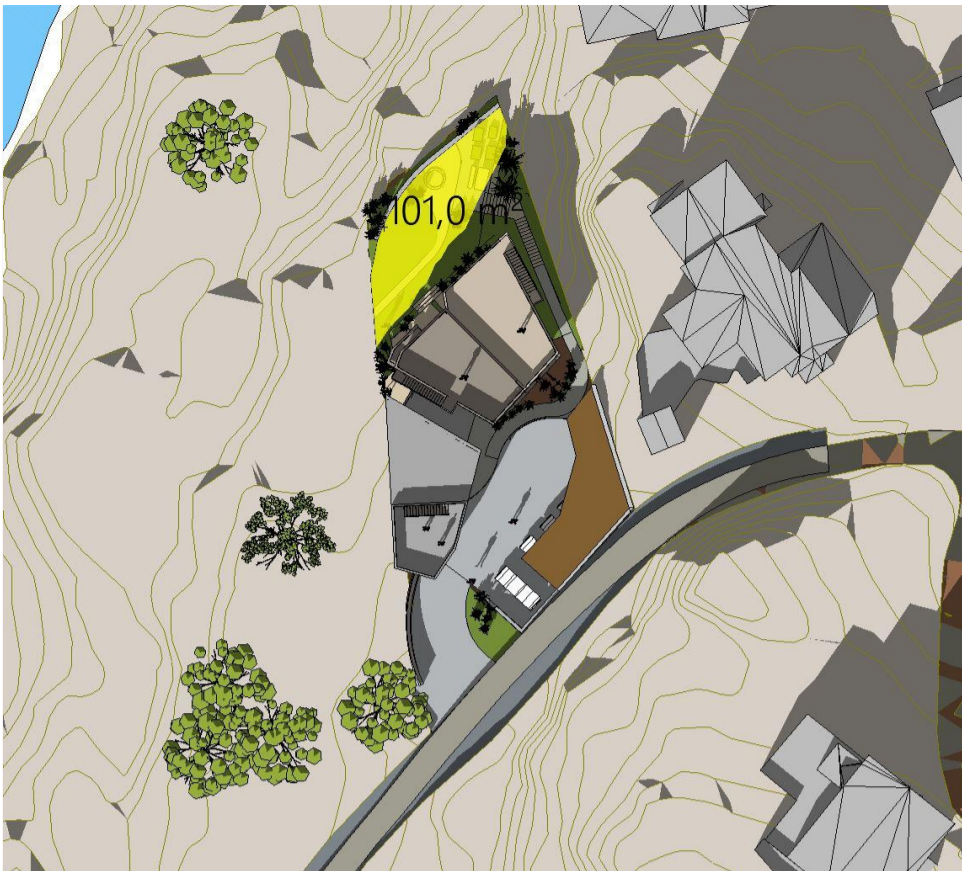
21. Mars kl 15 - Ny situasjon