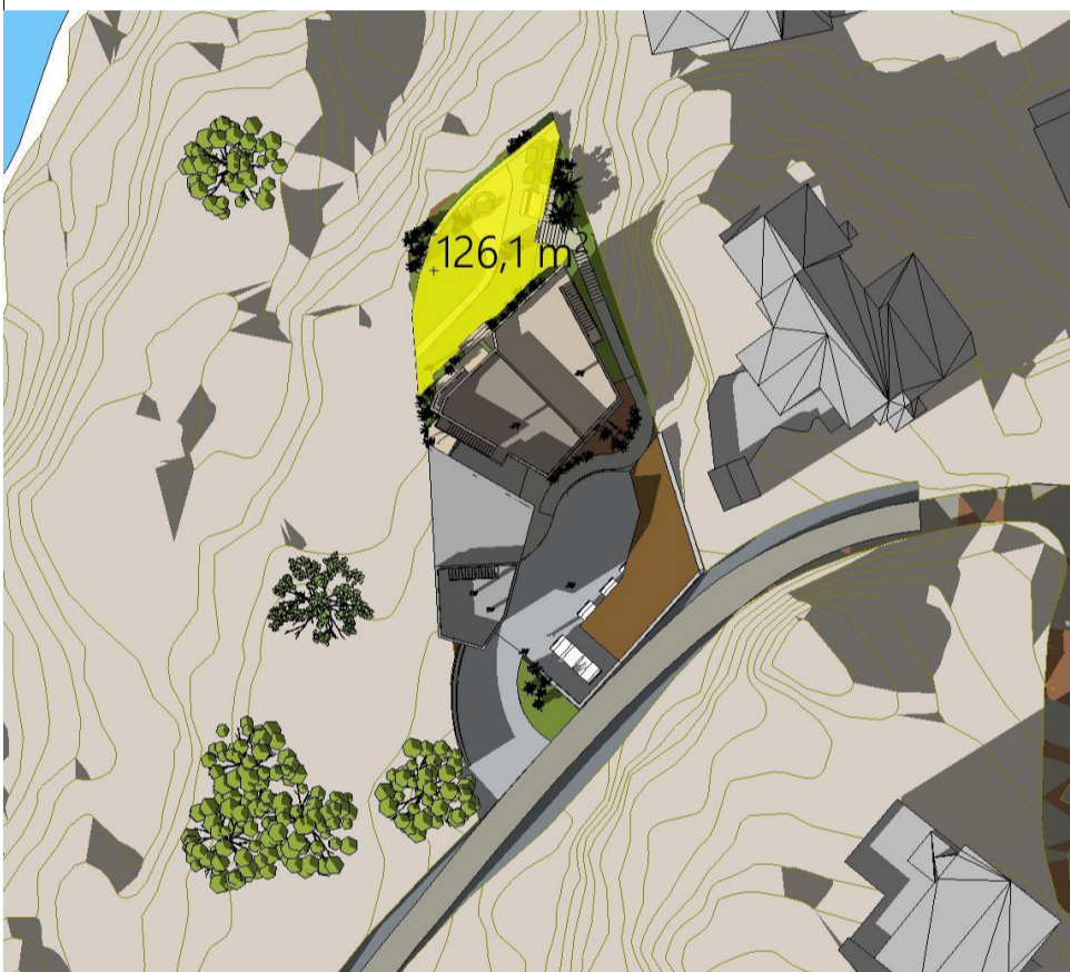
21. Mars kl 17 - Ny situasjon