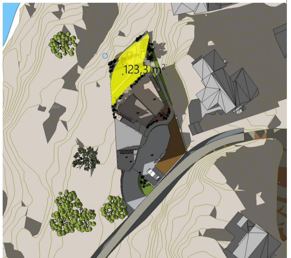
21. Mars kl 18 - Ny situasjon