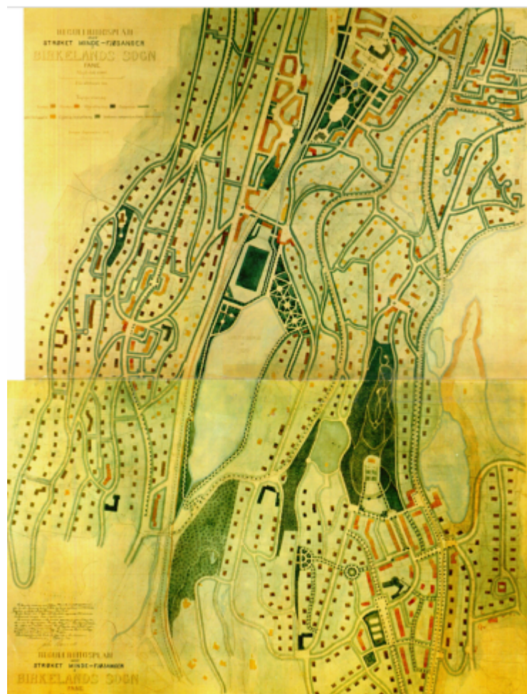
Figur 4 Opprinnelig plankart for reguleringsplanen Mindereguleringen.

Reguleringsplanen for Mindereguleringen er foreslått opphevet i dette planarbeidet, vist i figur 4. Utfordringen med å fortsatt ha reguleringsplanen som gjeldende plangrunnlag for eiendommene er at regulert situasjon på plankartet ikke stemmer overens med slik området er blitt utbygget flere steder innenfor planområdet. Dette gir ukorrekt arealstatus for flere av eiendommene. Reguleringsplanen er teknisk utdatert og ikke vektorisert (ikke gitt digitale arealformål). Linjene på plankartet hadde en annen juridisk betydning i 1920, enn etter dagens planverk. For grunneiere kan det være utfordrende å finne og forstå plansituasjonen for eiendommene innenfor planområdet. I tillegg dannes det ulik praksis for hvordan planmyndigheten håndterer planinformasjonen i eldre reguleringsplaner. For søknad om nye tiltak må kommunen og grunneiere forholde seg til det som er regulert, så lenge reguleringsplanen er gjeldende. Dette skaper en u hensiktsmessig saksbehandling i en eventuell byggesak for nye byggetiltak innenfor planområdet, og skaper tolkning-, håndtering og dispensasjonsspørsmål.