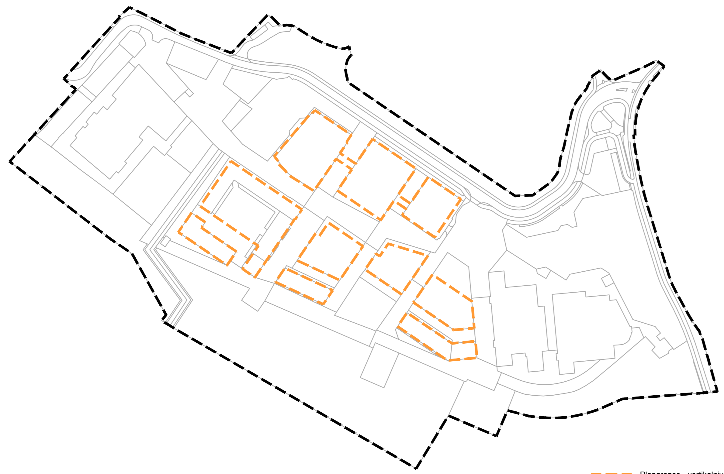
Utsnitt 1 - Illustrasjon av vertikalnivå M=1:2000

--- Plangrense - vertikalnivå 1 - under grunnen --- Plangrense - vertikalnivå 2 - på grunnen --- Formålsgrense