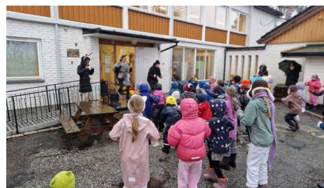
Karnevalssamling på Eventyrskogen

Fredag før vinterferie var det endelig tid for karneval igjen. Krohnengen skole arrangerer karneval hvert 4. år, i skuddår. Både stor og små stilte i kreative utkleddinger og så ut til å kose seg. Vi feiret med å møtes til felles sangstund, gikk i tog gjennom nærområdet og hadde limbo- konkurranse i de ulike klassene.