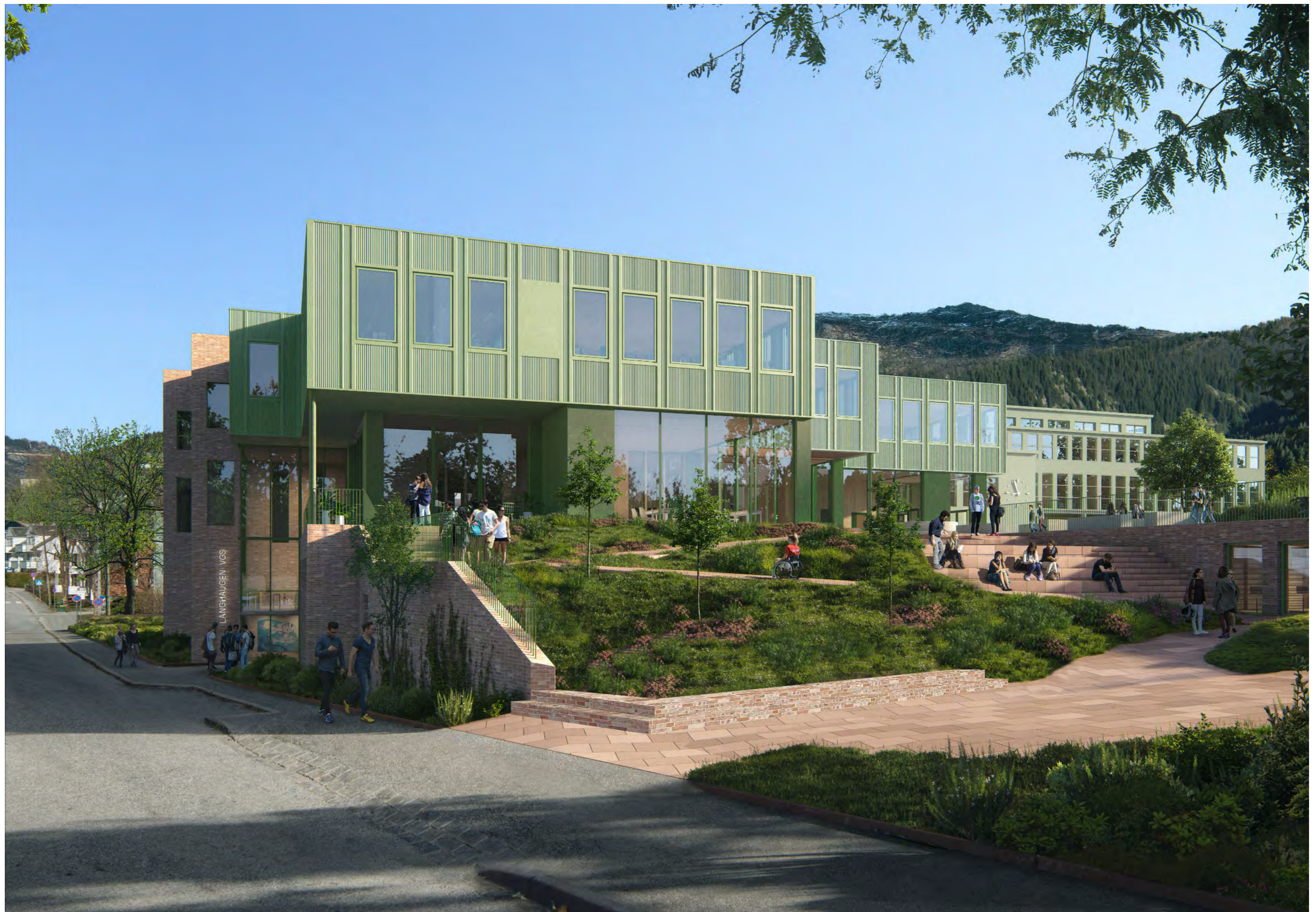
Nye Langheuagen skole sett fra Slettebakksvei med eksisterende skolebygg i bakgrunden. På grunn av nybyggets formmessige avtrapping, kan eksisterende bygg ses fra nesten alle steder rundt skoletomta.