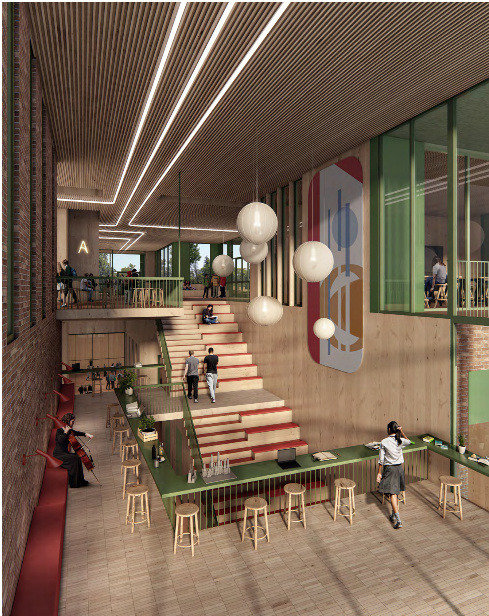
Skolens gjennomgående "hjerne" sett fra Slettebakksvei.