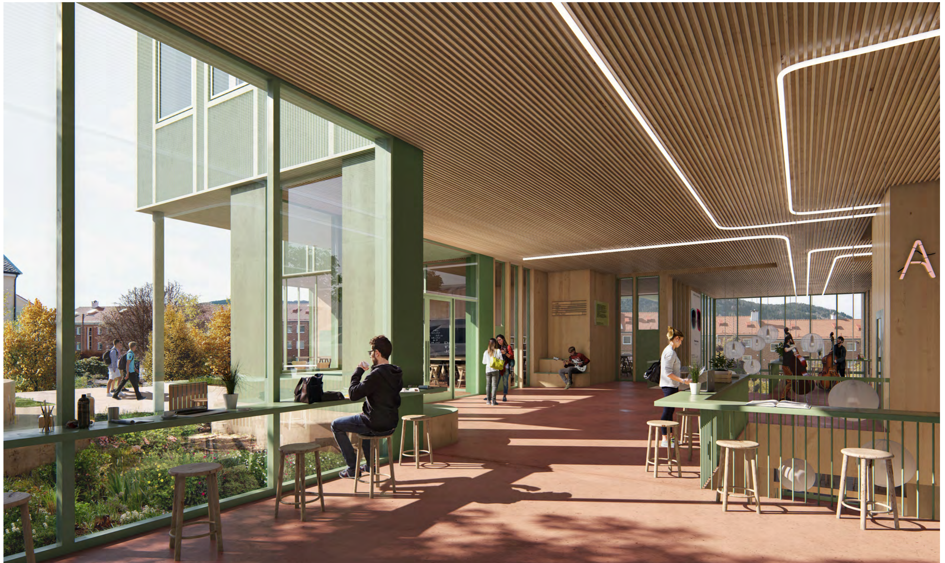
Illustrasjonen viser et perspektiv sett fra skolens gjennomgående "hertesone", som strekker seg helt fra eksisterende bygg og gjennom nybygget fra øvre til nedre nivå mot Slettebakksvei i vest. Her ser man ut på øvre del av uterommet kalt Solbakken, og rett fram ses bolibebyggelsen Slettebakksveien. De høye vinduene til høyre i bildet viser amfirommet som går ned til hovedinngangen fra Slettebakksvei