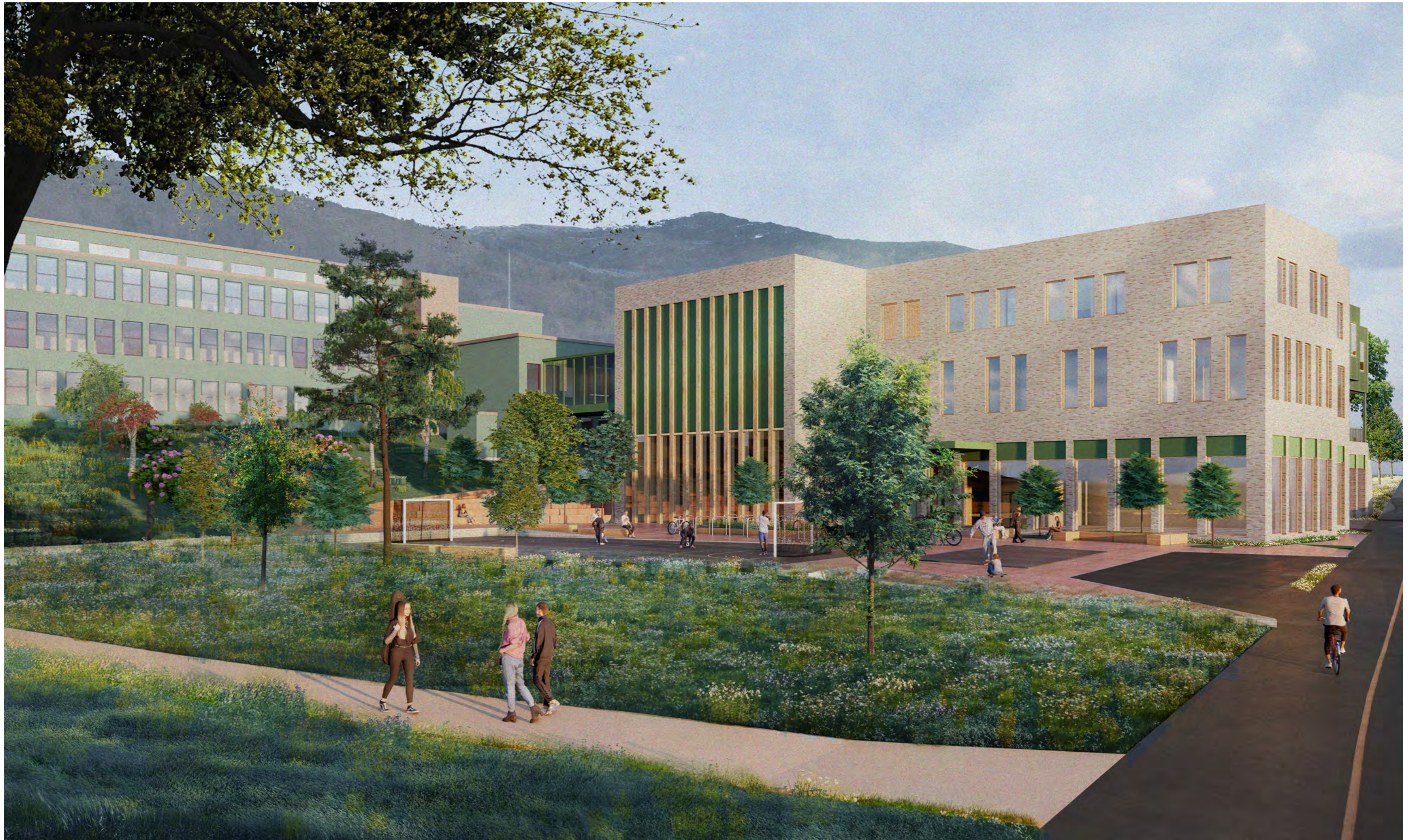
Sett fra Slettebakksveien i nord. Skolens konsertsal vender ut mot den delen av utearealet som ligger i umiddelbar forbindelse til grøntdraget Frilandsparken i nord.