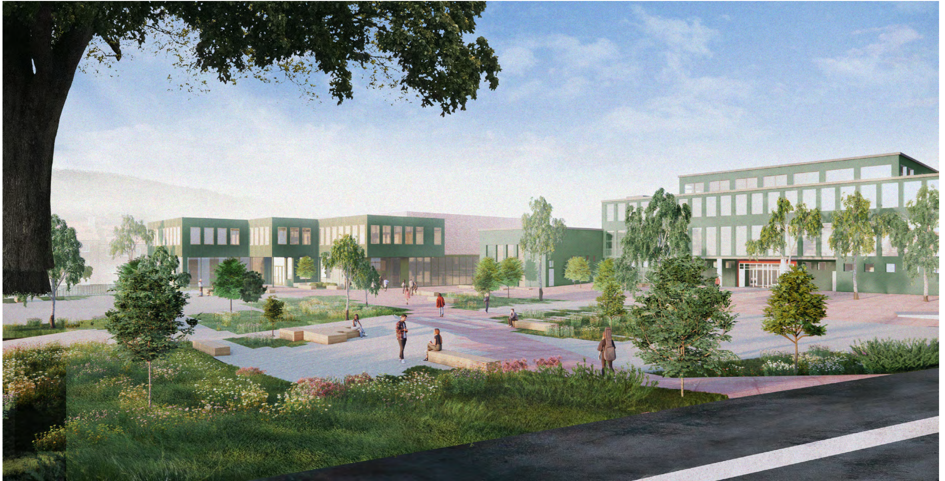
Øvre skoleplass sett fra Hagerups vei