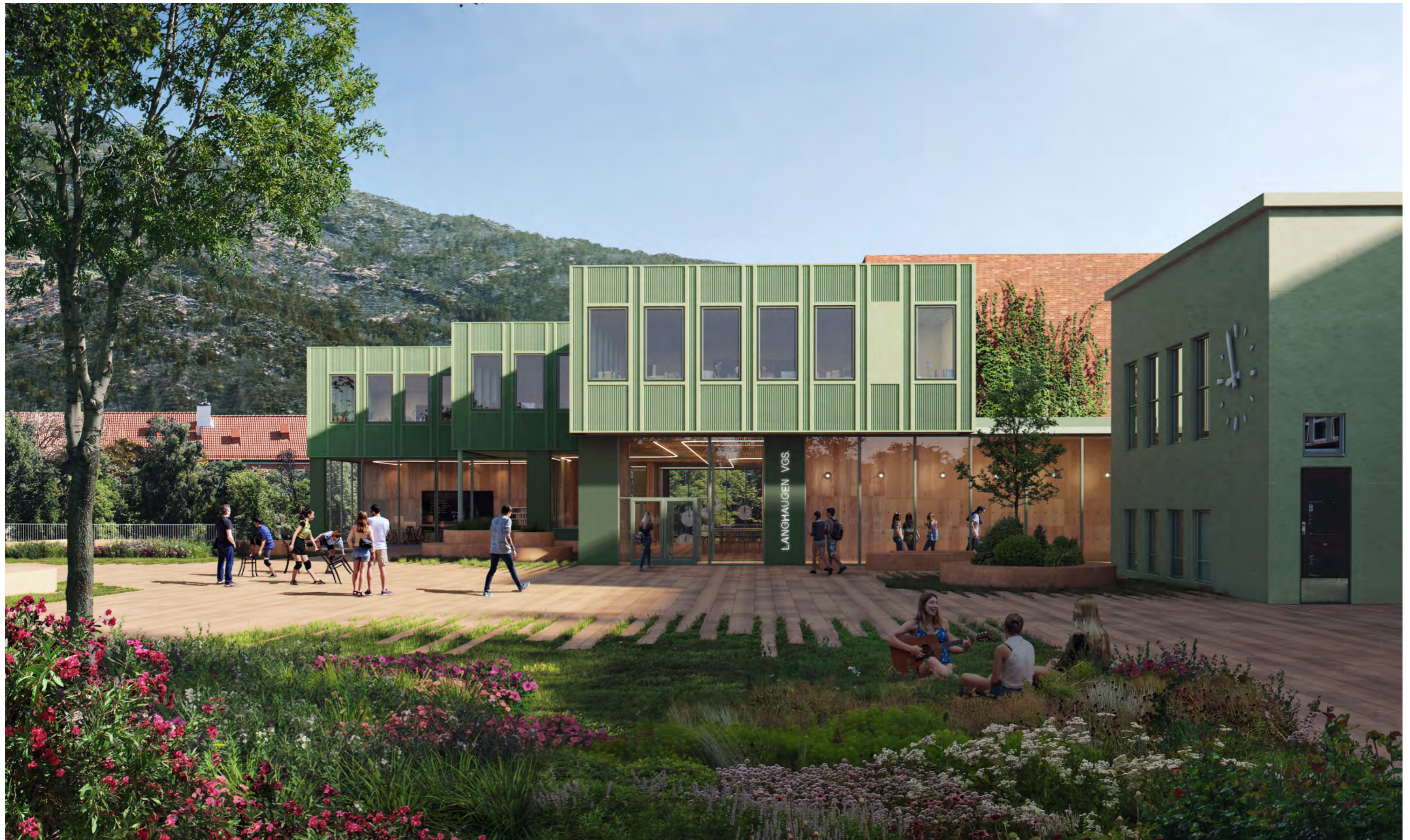
Sett fra øvre skoleplass, litt nærmere nybygget. Forbindelsen til utearealet mot Frilandsparken kan anes mellom gammelt og nytt skolebygg til høyre i illustrasjonen.