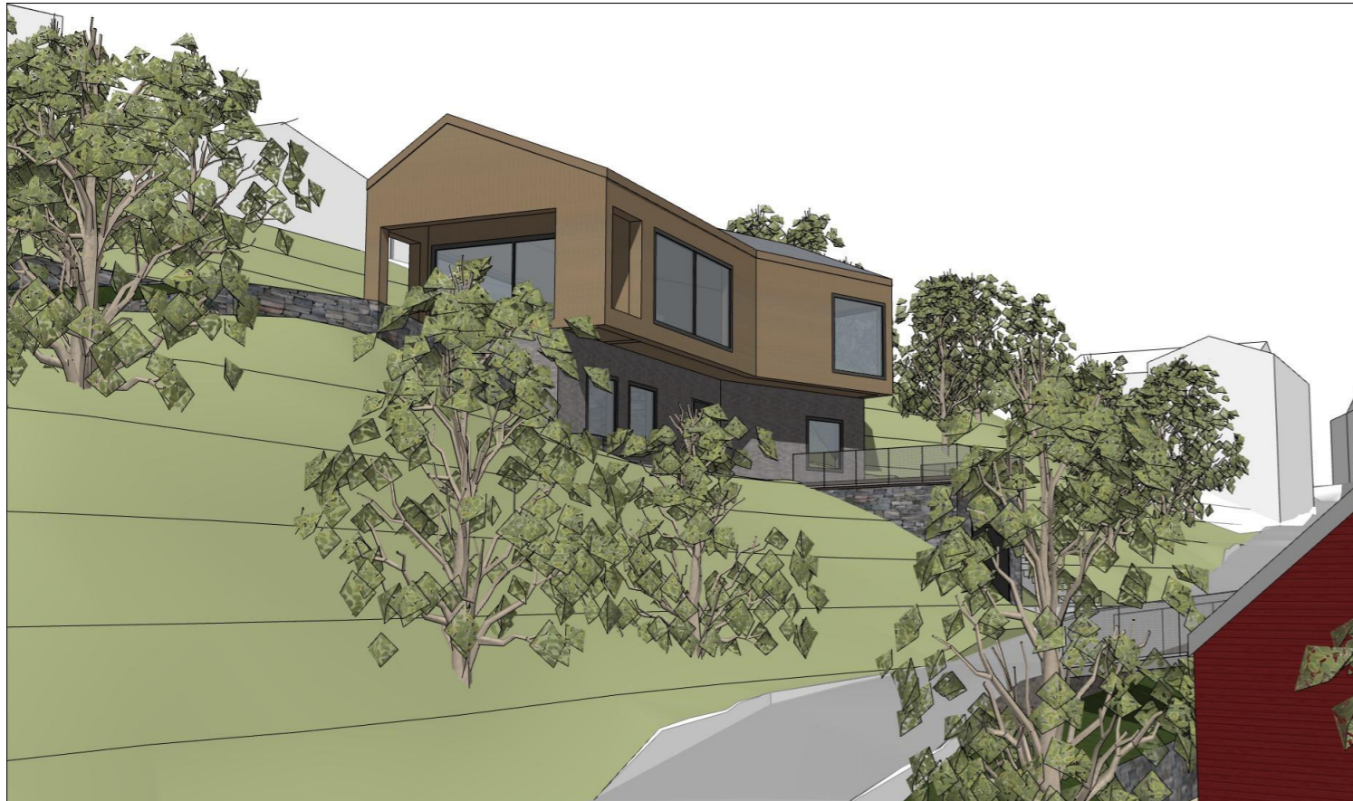
Perspektiv enebolig fra gate mot nord