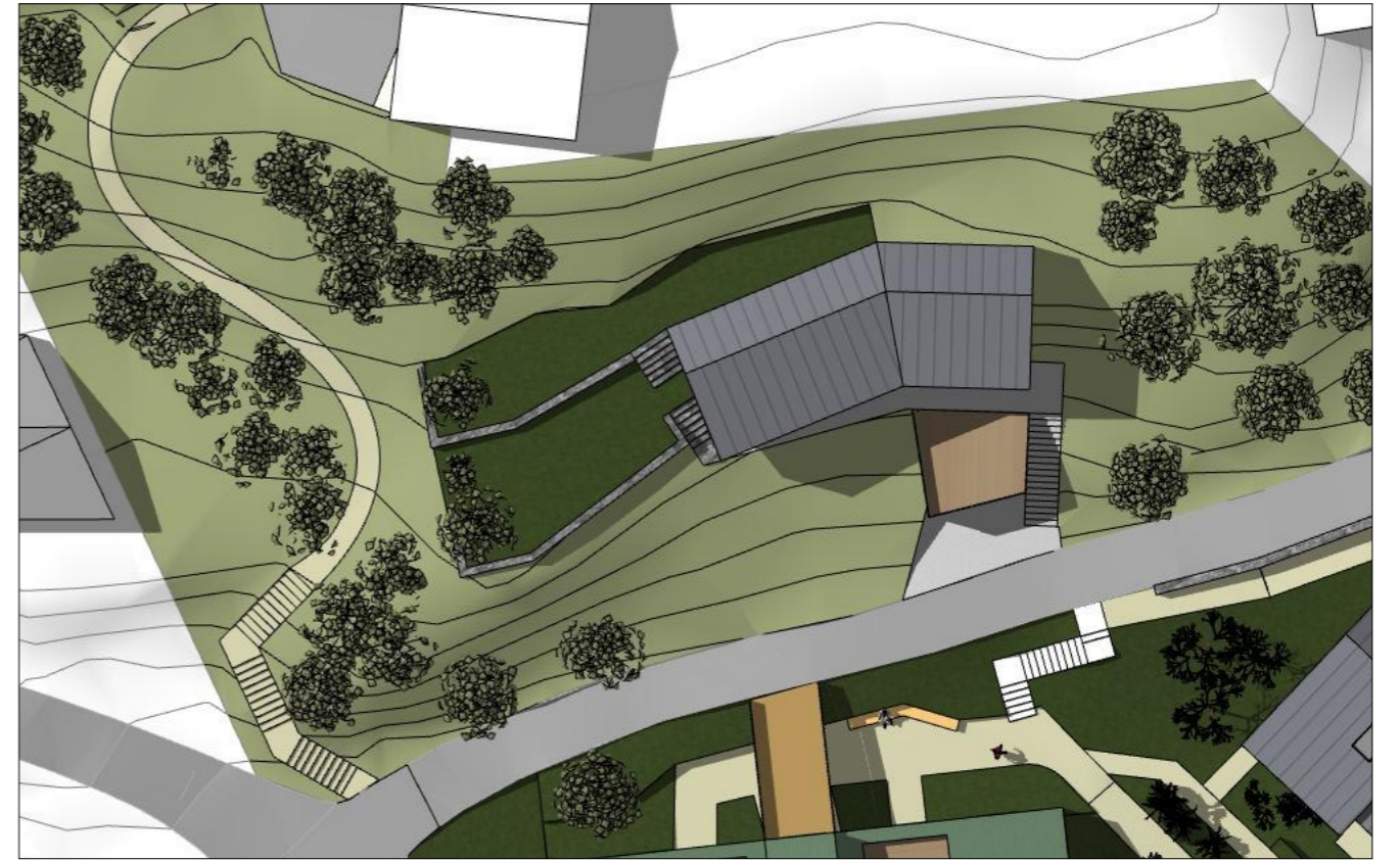
Plan enebolig, følger kotene