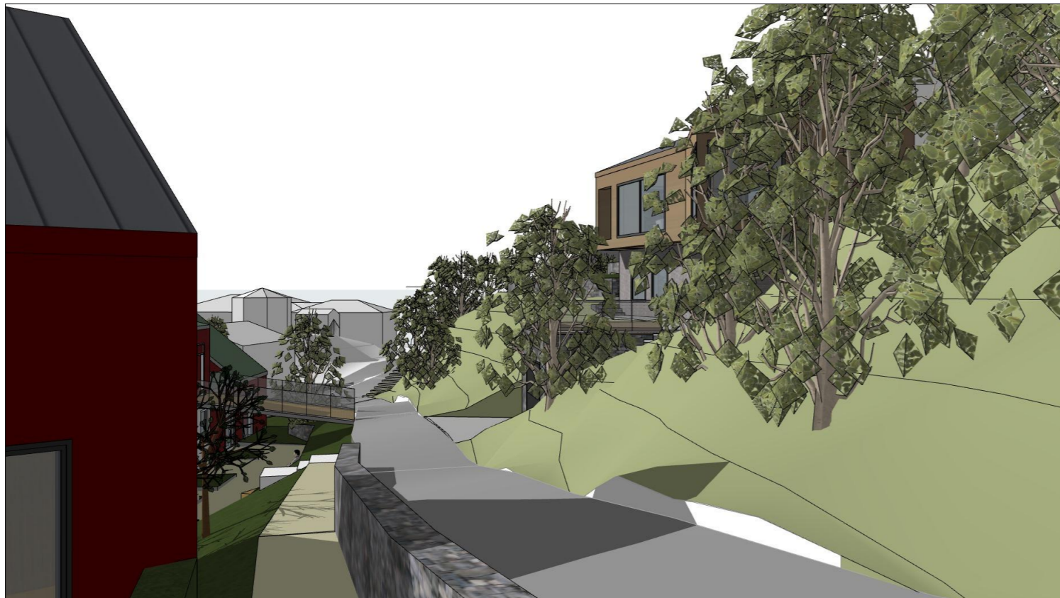
Perspektiv enebolig sett mot sør