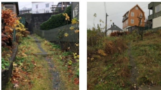
Figur 2: T.v.: Sti mellom Lille Damsgårdsvei - Kringsjåveien T.h.: Sti mellom Stadionveien - Nygjerdet

Gangstien som kobler Nygjerdet og Stadionveien fungerer som tilkomst til boliger og er en opptråkket sti som snarvei. Helningsgraden ligger på om lag 8%.