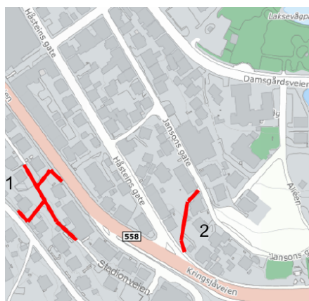
Fig.3: Gangtraséer under regulering.

Gangekartleggingen «Reparasjonstiltak for gangnettet i Laksevåg» er gjennomført som del av oppfølgingen av Gåstrategi for Bergen 2020-2030. Det er startet opp planarbeid for regulering av to viktige gangforbindelser på Laksevåg, se fig 3: