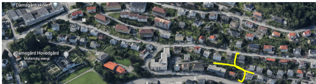
Figur 1: Veiarealenes beliggenhet i Laksevåg bydel.

Saken gjelder offentlig ettersyn og høring av et forslag til offentlig detaljreguleringsplan i Laksevåg bydel. Plan- og bygningsetaten (PBE) fremmer, på vegne av Bergen kommune, et planforslag som regulerer gangforbindelser mellom Lille Damsgårdsveien og Kringsjøveien, og mellom Nygjerdet og Stadionveien. Arealformål er i hovedsak gangveier med innslag av privat og offentlig veg.