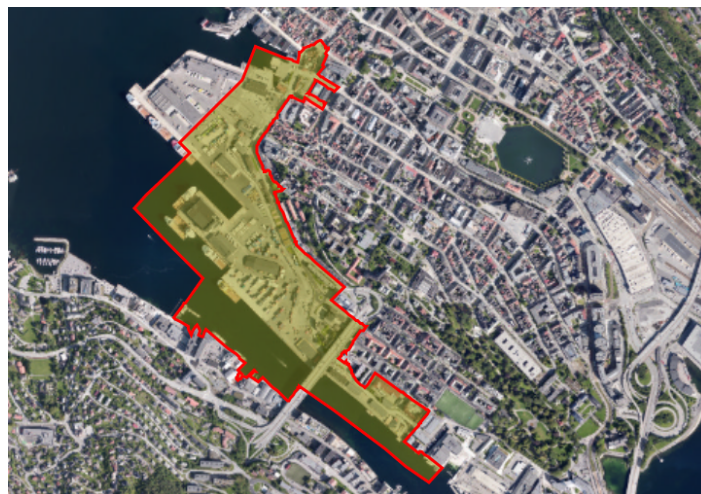
Figur 1. Planavgrensning

Hensikten med planarbeidet er å tilrettelegge for helhetlig og framtidsrettet byutvikling sentralt i Bergen, og sikre gjennomførbarhet av dette. Det skal planlegges for en urban, bærekraftig transformasjon av dagens havneområde til et levende byområde for alle, med boliger, gode byrom, næring, sosial infrastruktur, og energi- og miljøløsninger som gir bærekraft og nullutslipp.