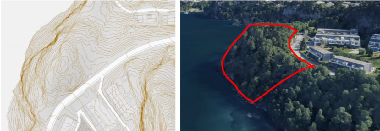
Figur 5 og 6: Utsnitt som viser høgdekoter per meter og dagens situasjon i planområdet vist med omtrentleg raud markering.

PBE viser til at forslagsstillar i etterkant av høyring og offentlig ettersyn har gjort fleire endringar i busetnaden. PBE viser til at det i den avgrensa høyringa i 2021 blei varsla auka byggehøgde frå k+44 til k+45 i felt BBB2 og frå k+42 til k+43,5 i felt BBB1 for å trappe ned busetnaden for mellom anna å gi betre tilpassing til omgivnadane, bevare siktlinjer og redusere negative konsekvensar for naboar. PBE vurderer at dette er ei forbetring av planforslaget sjølv om det gir reduksjon av utnyttingsgrad.