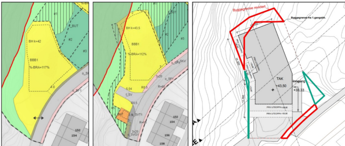
Figur 7: Endringar i plankart for felt BBB1 frå høyring/offentleg ettersyn (til venstre) til sluttbehandling (i midten). Raud strek viser byggegrensa på 25 meter mot sjø. Til høgre er det vist kva for område der byggegrensa er føreslått utvida (i raudt) og område der byggegrensa er redusert samanlikna med høyring/offentleg ettersyn (i grønt).

PBE viser til at føremåls- og byggegrense er utvida mot nordvest til nord og sør etter offentlig ettersyn, sjå figur 7. Bygget i felt BBB1 er forlenga mot Bjørndalspollen i første og andre etasje. PBE vurderer at endringane i felt BBB1 ikkje vil gi betre landskapstilpassing med mindre terrenginngrep og betre ivaretaking av siktlinjer enn planforslaget til høyring og offentlig ettersyn.