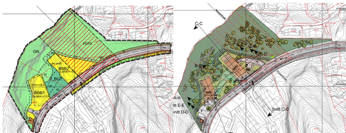
Figur 3 og 4: Utsnitt av plankart og utsnitt av illustrasjonsplan

%-BRA i felt BBB1 og 115 %-BRA i felt BBB2. Bygningvoluma er lagt inn mot kollen frå nord og sør, og blir kopla saman med eit felles uteareal (f_BUT). Bustadblokkene vil ha flate tak med vegetasjonsdekke, og det er opna for solenergianlegg på taka i kombinasjon med vegetasjonsdekket.