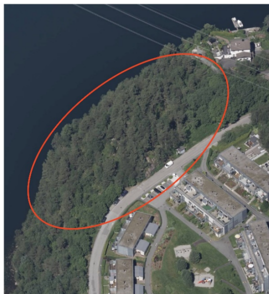
Figur 1 og 2: Planområdet

Føremålet med planforslaget er å legge til rette for inntil 17 bueiningar fordelt på to bustadblokker med tilhøyrande uteoppholdsareal og parkeringskjellarar. Planområdet er i dag eit urørt naturområde og består av ein grøn, skogkledd kolle.