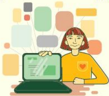
Samordning av tjenester