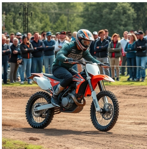
Bilde generert med AI

For å kjøre trenger du også kjøre lisens, hvis du er nybegynner kan man kjøpe prøvelisens og da kan man prøvekjøre 8 ganger, og hvis man liker trial etter å prøvekjørt de 8 gangene så kan du begynne, men da er det bare opp til foreldrene dine om de vil betale for alt.