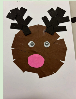
Kunst og håndverk med rød og grønn gruppe.

Matte: Denne uken arbeidet vi med dagens tall på tirsdag og mattelab på onsdag. På tirsdag var dagens tall 299 for de fleste, mens noen jobbet med egenvählte tosifrete tall. I arbeidet med dagens tall var tierovergang fokuset for de som arbeidet med 299. Leksen denne uken vil være en "dagens-tall oppgave" som vi har jobbet med på tirsdager. Denne uken snakket vi og arbeidet med hva som skjedde når ener- og tierplassen ble større enn 9. Ti enere er det samme som en tier. Ti tiere er det samme som en hundrer. Da flytter vi tieren over på tierplassen og hundrereren over til hundrerplassen. Vi vil jobbe videre med tierovergang neste uke.