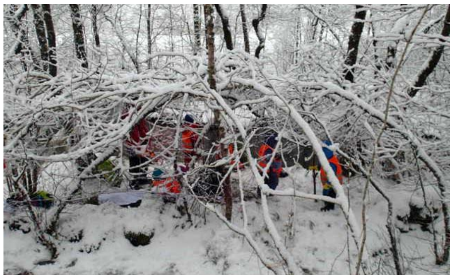
Hytten slik den så ut 12. februar 2018

Kart fra prosjektet med fjorårets 4-åring-er. Kartet ble brukt av barna som orienteringsgunnlag i prosjektet "luftskip".