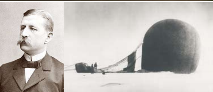
Salomon August Andrée la ut på i et forsøk på å nå Nordpolen i 1897.