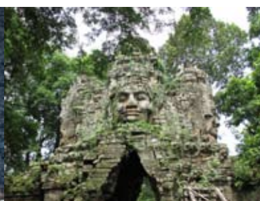
gammel Maya sivilisasjon