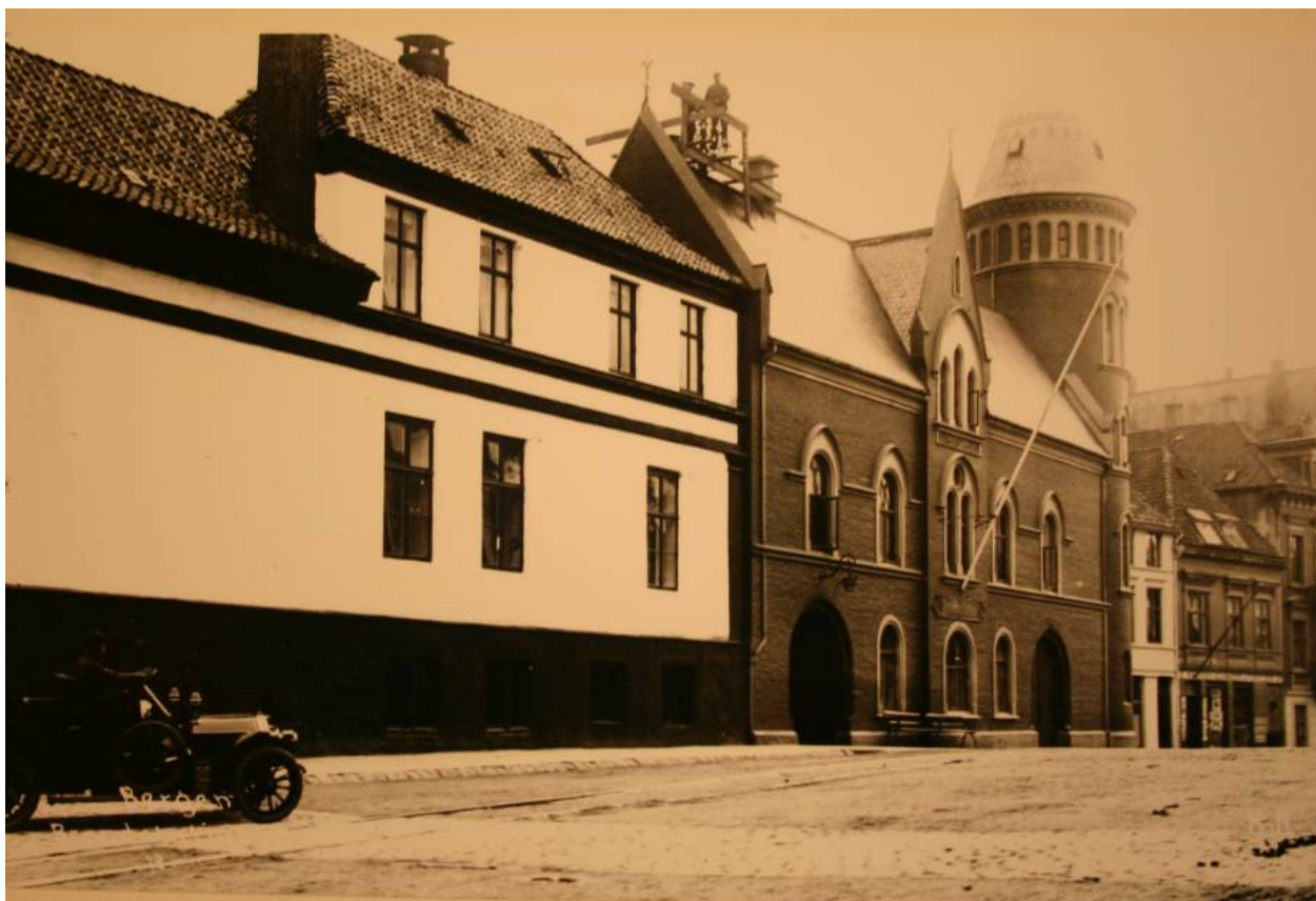
Figur 5. Nordfasaden til Hagerupsgården mot Christies gate i mellomkrigstiden. Gamle Brannstasjon til høyre.

Hagerup sine arvinger solgte huset til Bergens børs- og handelskomité, som planla å rive bygningen og bygge børs på tomten. Det ble så solgt videre til kommunen i 1858 og fem år senere ble det tatt i bruk som brannstasjon. Bygningen fungerte som en del av brannstasjonen til 2007.