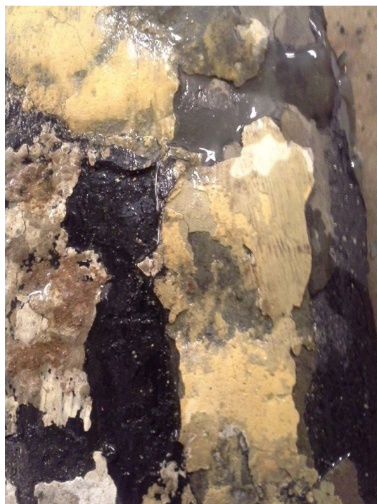
Takgesims. (bilde tatt fra baksiden av malingsflak)