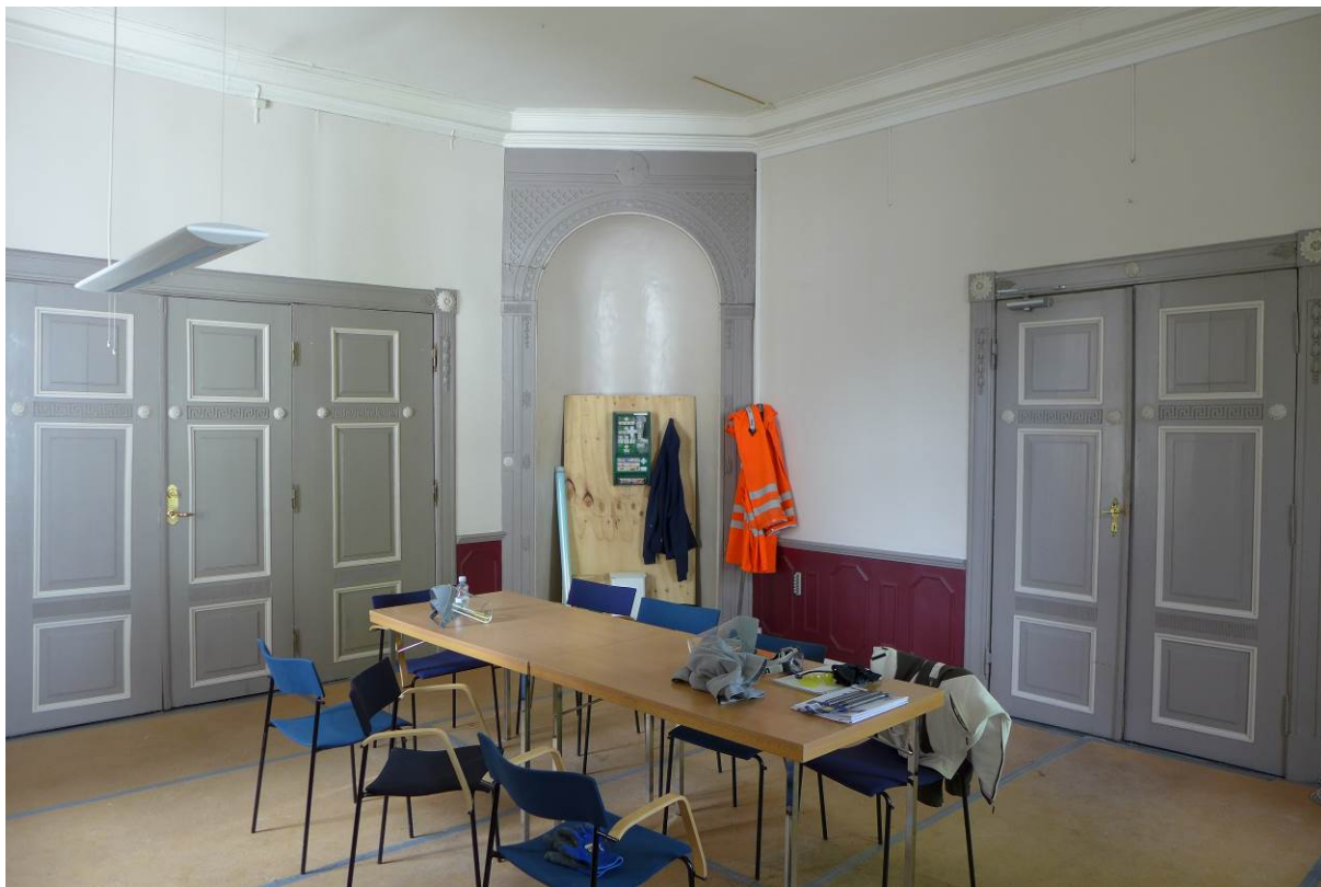
Figur 16. Sal mot sør fra inngangshall, med stor hengslet dør til innen forliggende salong.