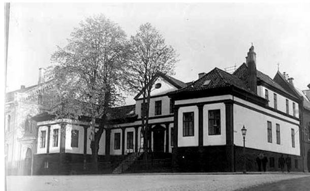
Figur 3. Inngangsfasaden til Hagerupsgården på 1920-tallet.

Reguleringsplanen fra 1855, som omfatter store deler av sentrum, medførte også endringer i gatenettet i dette området. Planen var drastisk og hadde, etter datidens planidéer, en moderne kvartalsstruktur som ideal. De eksisterende gateløp ble beholdt, men rettet ut og forlenget for å tilpasses den nye bystrukturen man ønsket. Resultatet ble at Christiesgate fikk dagens utforming med utgangspunkt i den nordre enden som var et gammelt gateløp. Planen innbefattet også en utvidelse og retting av Muségaten (nå Rådhusgaten) da bebyggelsen på vestsiden brant i 1855. Peter Motzfeldts gate og Kaigaten inngikk i 1855-planen, men ble først realisert flere år senere. De ubebygde plassene og kommunikasjonslinjene forteller om viktige deler av den historiske utviklingen i området. Samlet sett er dette viktige byområdet et kulturminnemiljø av nasjonal verdi.