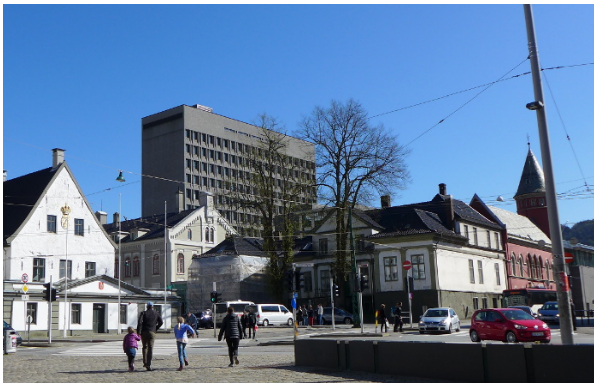
Figur 19. Bergens historiske administrasjons- og justisentrum: Rådstuplass med Gamle rådhus, Gamle tinghus, Hagerupsgården og den gamle hovedbrannstasjonen. Dagens rådhus ruver i bakgrunnen (Foto: Byantikvaren 2015).

Foran bygningen ligger Rådstuplass med Det gamle rådhus sentralt plassert. De ubebygde plassene og kommunikasjonslinjene mellom bygningene i Rådhuskvartalet forteller om den historiske utviklingen i området. Samlet sett er dette byområdet et kulturminnemiljø av nasjonal verdi.