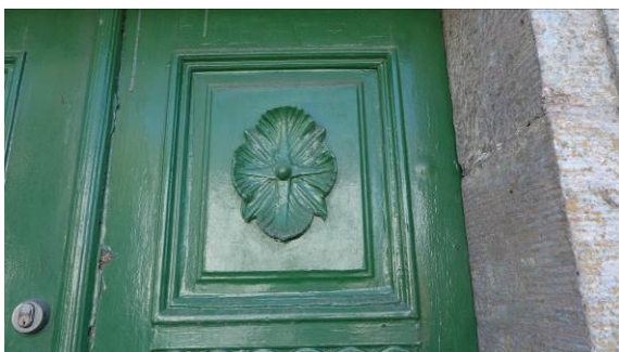
Figur 7. Detalj fra døren i hovedportalen.