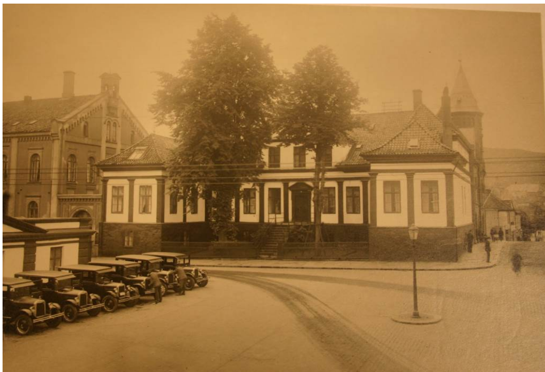
Figur 4. Inngangsfasaden til Hagerupsgården i mellomkrigstiden.