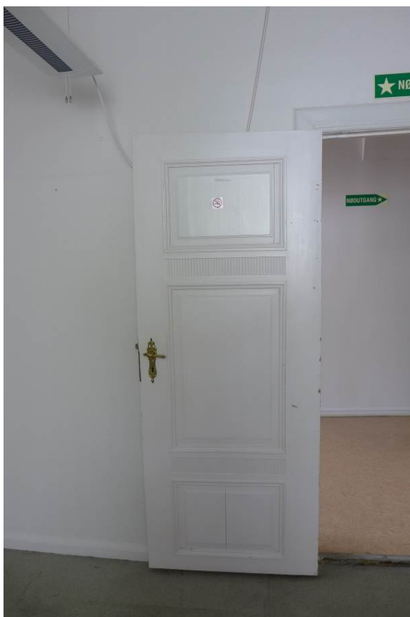
Figur 17. Loft i søndre sidefløy (Foto: Byantikvaren 2015).