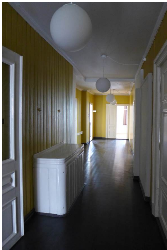
Figur 15. Det ble gjort en del endringer da Hagerupsgården ble brannstasjon. Gangen i overetasjen, med interiør fra siste del av 1800-tallet.