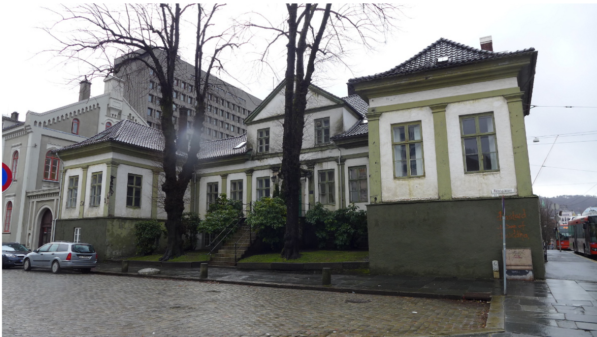
Figur 6. Frontfasaden til Hagerupsgården mot Rådstuplass (Foto: Byantikvaren 2015).

I norsk målestokk var det et usedvanlig påkostet prosjekt, et arkitektonisk gjennomført bypalé i barokken foretrukne grunnplan, med en hovedfløy og to fremskutte sidefløyer på hovedfasaden. Hovedinngangen er sentralt plassert og markert med klebersteinsportal og en bratt trapp opp fra bakkeplanet. Over inngangen er en sekundær bred ark som gjentar portalens motiv. På deler av hovedfløyen, ut mot baksiden og på en av sideveggene, er loftet bygget ut til en full 2. etasje. Bak huset lå tidligere en stor gårdsplass, omgitt av en murer og flere uthusbygninger, og på sørsiden lå en hage. I dag er bygningen omkranset av Gamle tinghus, Gamle brannstasjon, Christies gate og Rådstuplass. Schreuders bygning sies å ha vært forbilde for både Zander Kaas stiftelse, Danckert Krohns stiftelse og Lungegården.