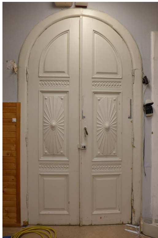
Figur 13. Empire-dør inn til søndre sidefløy.