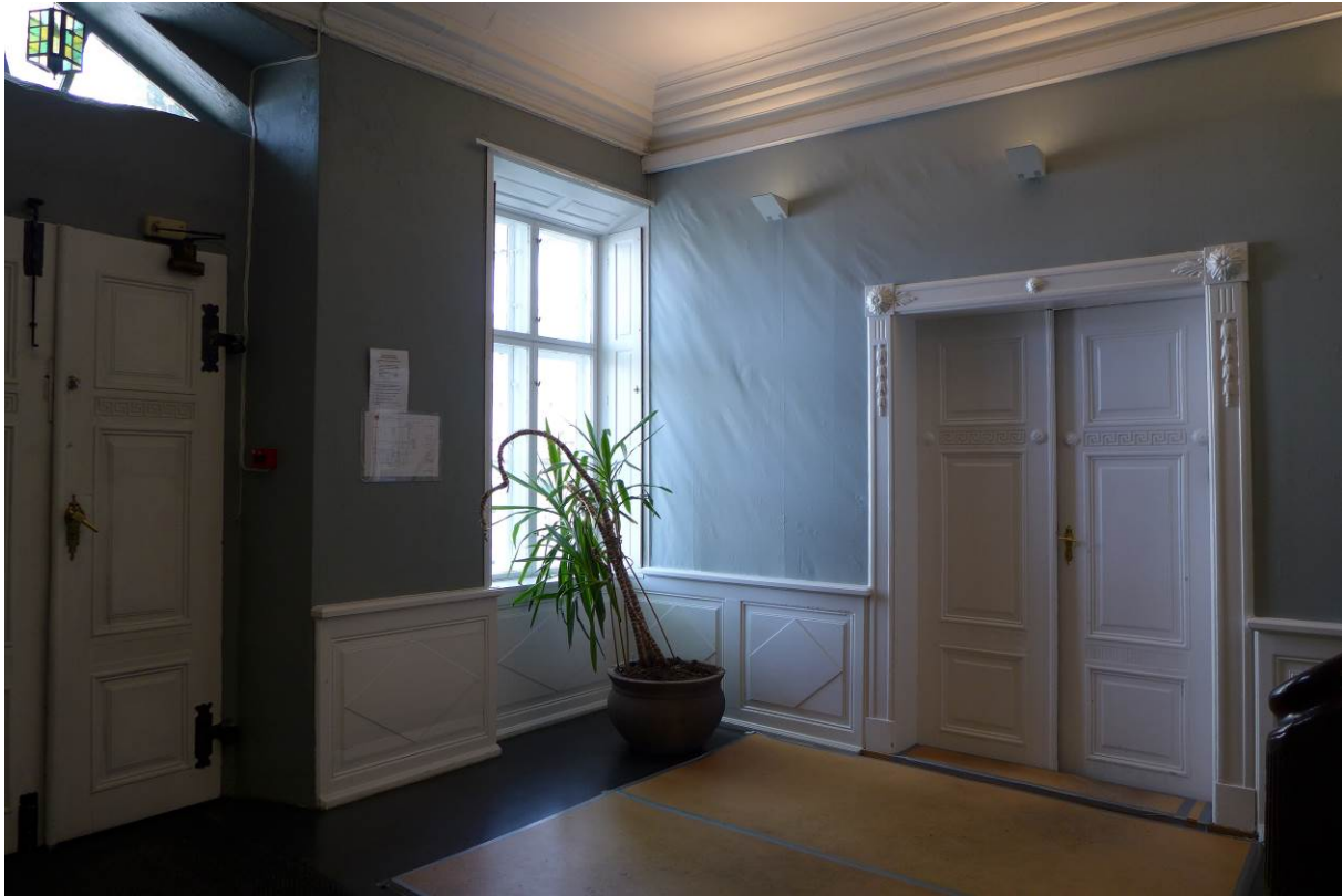
Figur 11. Inngangspartiet i hovedetasjen, ombygget i 1810 i rik empirestil, trolig med overflatene rehabilitert på 1920-tallet.

Vi vet som sagt lite om bygningens tidlige historie, men tidlig på 1800-tallet, trolig i forbindelse med at Hagerup overtok i 1809, har det skjedd omfattende endringer i interiøret. Adkomsten er en stor hall med romsuitoer på hver side og mot bakplassen.