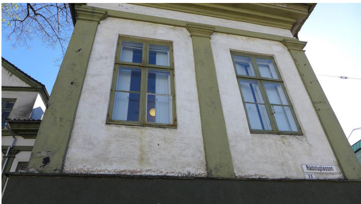
Figur 10. Vinduene i hovedetasjen er empire-vinduer fra første halvdel av 1800-tallet.

Den gamle hovedbrannstasjonen er bygget inntil bakfasaden på begge sider, og midtpartiet vender ut mot gårdsrommet til denne. Her er en murt trapp opp til en plattform båret av en støpejernsøyle, og med et bislag med liggende panel og takterrasse på. Veggflatene og frisen er hvite, mens sokkeletasjen, lisener, arkitrav, gesims og vindu er malt i forskjellige grønne og grågrønne nyanser. Døren i hovedportalen er skarpt grønn.