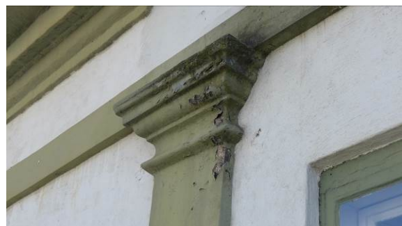
Figur 8. Hovedetasjen har lisener mellom hvert vindusfag.