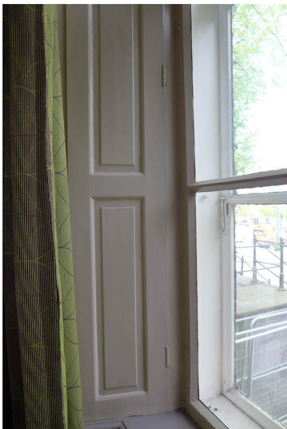
Figur 14. Innebygde vindusskoder, trolig fra tidlig 1800-tallet.