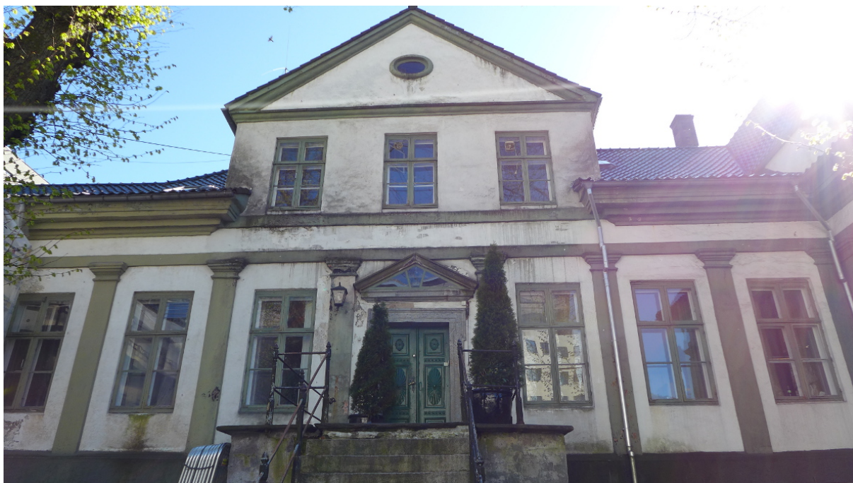
Figur 9. Hovedportalen med trekantgavl over (Foto: Byantikvaren 2015).

Den gamle hovedbrannstasjonen er bygget inntil bakfasaden på begge sider, og midtpartiet vender ut mot gårdsrommet til denne. Her er en murt trapp opp til en plattform båret av en støpejernsøyle, og med et bislag med liggende panel og takterrasse på. Veggflatene og frisen er hvite, mens sokkeletasjen, lisener, arkitrav, gesims og vindu er malt i forskjellige grønne og grågrønne nyanser. Døren i hovedportalen er skarpt grønn.