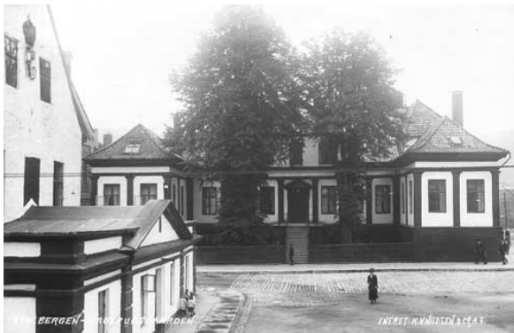
Figur 2. Historisk foto av frontfasaden til Hagerupsgården, med Gamle rådhus i forgrunnen, i 1917.