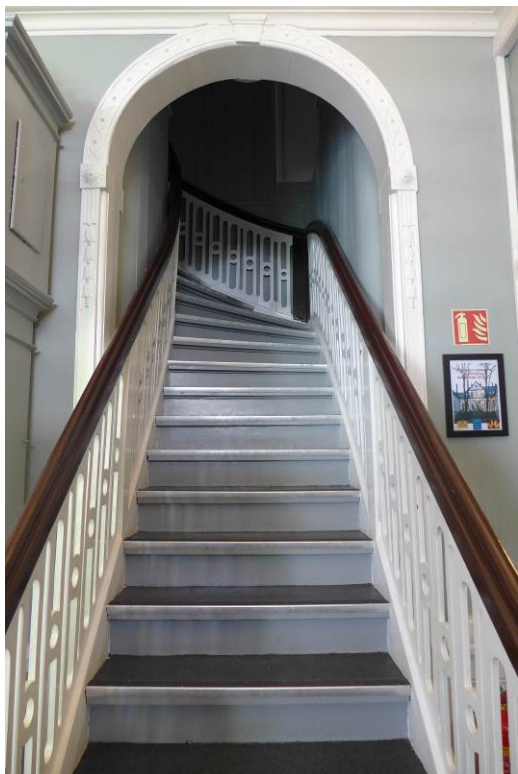
Figur 12. Hovedtrapp til andre etasje fra tidlig 1800-tallet.