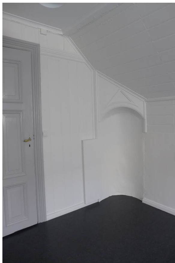
Figur 18. Ovnsnisje. Loft, søndre sidefløy (Foto: Byantikvaren 2015).