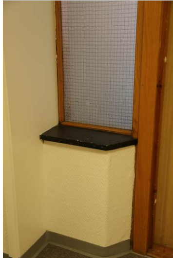
Figur 11. Detalj ved inngang til Bergen og Årstad kulturkontor.