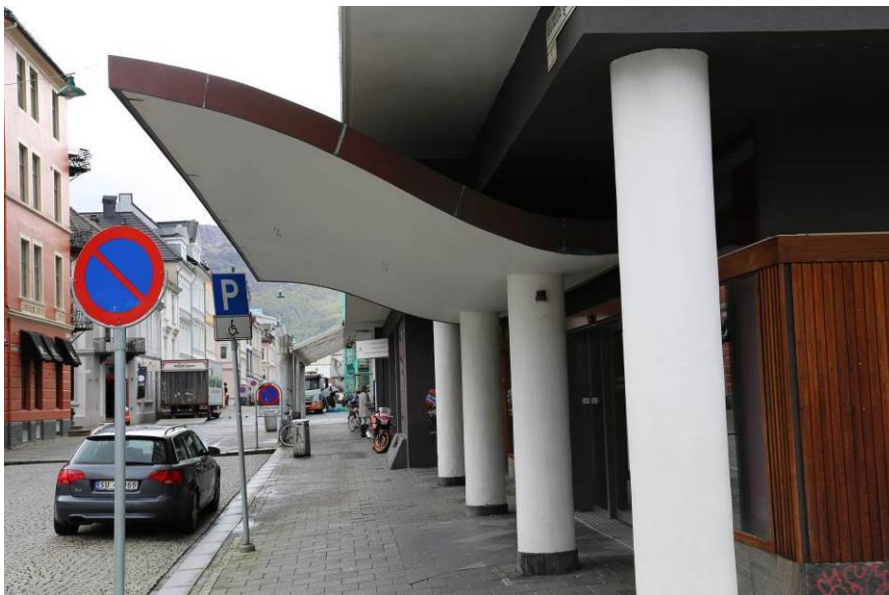
Figur 8. Baldakin med søyler over den tidligere hovedinngangen til Engen kino.