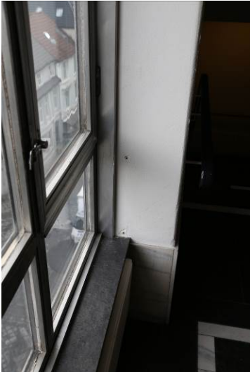
Figur 10. Originalt vindu med skifersålbenk