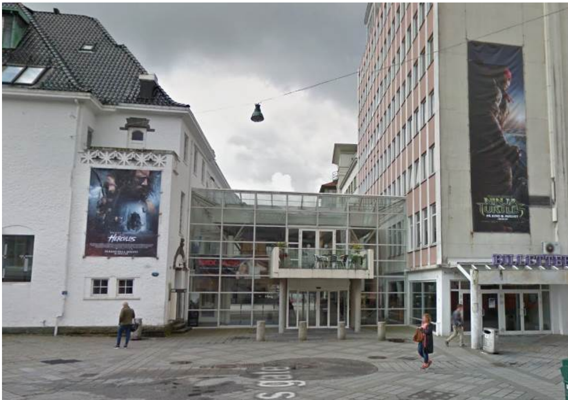
Figur 13. Uteområde i Sverresgate. Mellombygg som knytter bygningene sammen, utført da Konsertpaléet og Engen kino ble bygget sammen til storkino.

Teatergaten går på vestsiden av bygningen. Neumanns gate 1 ligger svært eksponert på hjørnet mellom Neumanns gate og Teatergaten og er en viktig markør av dette hjørnet.