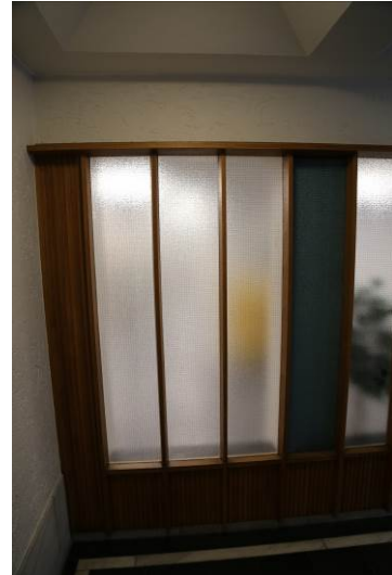
Fig 12. Detalj av inngangsparti til kontorer.