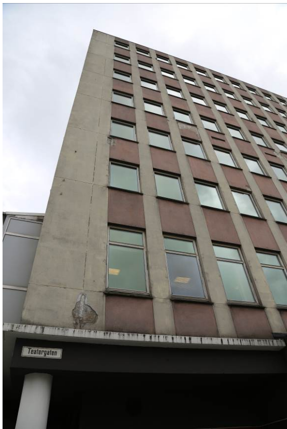
Figur 6. Fasade mot Teatergaten (Foto: Byantikvaren 2015).