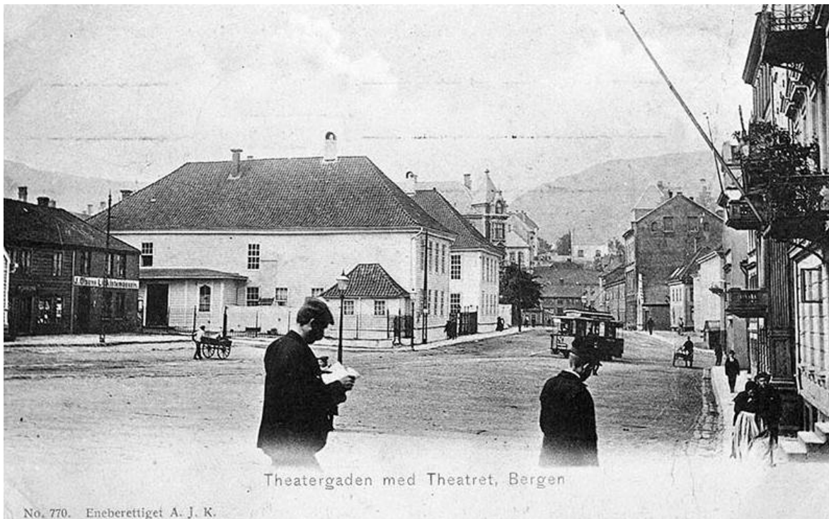
Figur 2. Det Gamle Teater som lå der Neumannsgate 1 er i dag.