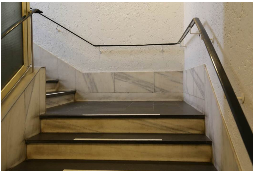
Figur 9. Fra trapperom. Skifertrinn, marmor nederst på veggen mot gulvet, originale håndløpere (Foto: Byantikvaren 2015).

Interiøret er godt bevart i trappeoppgangen. Her finner vi trappetrinn i skifer og bruk av edeltre i detaljering. Nederste felt på veggen er i marmor, og det er innsalg av marmor i skifergulvet. Det er originale vinduer i trappeoppgangen. I alle etasjer fra 3-9 er veggen inn mot kontorlokalene utført i smale stående teakstaver, med vertikale trådglassfelt mellom. Selve inngangsdørene er skiftet ut. Kontorlokalene er endret flere ganger i løpet av årene, i takt med endrete behov og ulike aktører som har hatt kontor her.