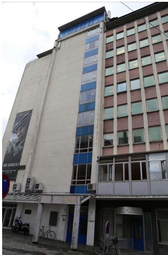
Figur 7. Fasade mot Neumanns gate (Foto: Byantikvaren 2015).

Den 9. etasjen er tilbaketrukket, og heis- og trappehuset går enda en etasje over der igjen. Denne avtrappingen gir bygningen et skulpturelt og neddempet uttrykk. I sokkeletasjen på fasade mot Neumanns gate og Teatergaten er det benyttet materialer av høy kvalitet, og disse kvalitetene er fremdeles bevart. Den mest i iøynefallende detaljen på fasade mot Neumanns gate, er baldakinen over inngangspartiet. Denne, sammen med en søylerekke, gir bygningen en helt spesiell karakter som løfter den over et ordinært «hverdagsbygg».