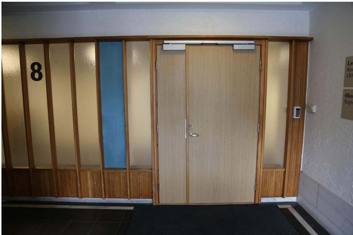
Figur 3. Original vegg med brystning i smale teakstaver og vertikale vindusfelt. Identisk fra 3.-9. etasje.

Her er det benyttet teak; med både smal teak-kledning, teakdører og teakomramminger rundt vinduene. I tillegg er det benyttet skifer nederst på vegg. Hoveddøren er i glass og var før fasadeendring i 2010/2011 utført i et lett materiale. Døren er nå erstattet med ny glassdør, men med mye bredere profiler i et tyngre materiale. Dette har redusert den estetiske verdien. Over det hele har vi den lett bølgete baldakinen som gir inngangspartiet et løft over det hverdagslige.