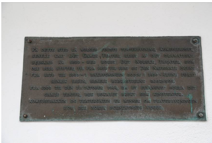
Figur 1. Plakett på veggen: «På dette sted lå Norges første teaterbygning, Komediehuset, senere kalt Det Gamle Teater, reist av det Dramatiske Selskap som Ole Bull stiftet, fra 1850 til 1863 og Den Nationale Scene fra 1876 til 1909. I Bakbygningen bodde i 1850-årene først Henrik Ibsen, senere Bjørnstjerne Bjørnson. Fra 1909 til den 20. oktober 1944, da et flyangrep ødela det Gamle Teater, ble lokalet brukt som kinoteater. Komediebakken og Teatergaten er minner om teaterbygningen som ble norsk scenekunsts vugge».

Neumann gate 1, tidligere Engen kino, er oppført på tomten til «Det Gamle Teater» (Komediehuset) som ble bygget i 1800 for Bergens dramatiske Selskab. Denne bygningen gikk tapt under 2. verdenskrig, bombet av britiske bombefly 1944. Engen kino åpnet i 1961, og ble i 1989 slått sammen med konsertpaleet til moderne storkino med flere saler. Bygningen har hele tiden også vært benyttet som kontorlokaler, slik at bygningen fremdeles har sine opprinnelige funksjoner.