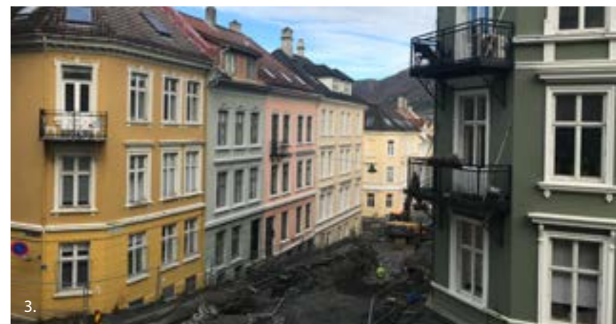
1. Ole vigs gate på Møhlenpris. Den strengt regulerte bebyggelsen med vakre murgårder er organisert i en kvartalstruktur med interne gårdsrom og forseggjorte fasaderekker mot gatene. 2. Vestre Torggate og Neumannsgate.. Variasjon mellom stilmessig uttrykk på murgårdene, fra pussete fasader med stukkatur og dekor til upussede teglsteinsfasader med like forseggjorte dekorelementer, tårn og pilastre. 3. Leiegårdene som ble bygget fra sentrum og oppover på Nygårdshøyden økte i både standard og leilighetsstørrelse jo lengre opp på høyden man kom. Slik forteller gårdsarkitekturen også en sosialhistorie.

De mest fasjonable murgårdene hadde store leiligheter som inneholdt stue, spisestue, kjøkken, entré, flere soveværelser, ofte med pikeværelse og dessuten kjellerbod og loftsbod. Toalettet var unntaksvis et vannklosett, men som regel kaggedo utenfor selve leiligheten.